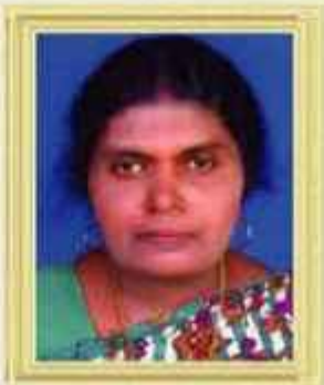
സിത്ഥി FHC കുളത്തൂർ തിരുവനന്തപുരം ജില്ല