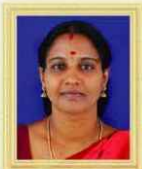
ഷീജ PHC എടപ്പട്ട മലപ്പുറം ജില്ല