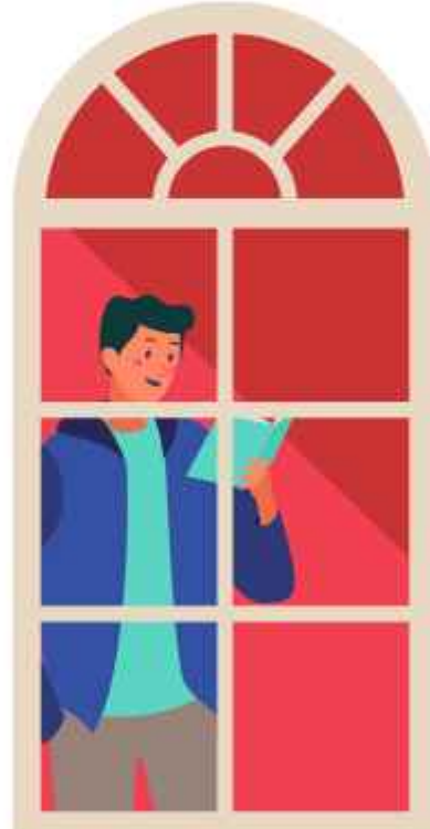
അന്താരാഷ്ട്ര യാത്രക്കാർ അറിയാൻ

ചെറിയ മാറ്റങ്ങൾ വരുത്തി നൽകുക, വീടുകളിലിരുന്നു ചെയ്യാൻ പറ്റുന്ന ജോലികൾക്ക് വേണ്ട സഹായങ്ങൾ ആവശ്യമുണ്ടെന്ന് കണ്ടെത്തിയവർക്ക് പാലിയേറ്റീവ് കെയർ പദ്ധതിയുടെ ഭാഗമായി നൽകുന്നുണ്ട്. ജില്ലയിലെ പാലിയേറ്റീവ് കെയറിന്റെ ഭാഗമായി പ്രവർത്തിക്കുന്ന 24 സെക്കണ്ടറി യൂണിറ്റുകളിലും ഇവരുടെ സേവനം ലഭ്യമാണ്. ഇതിന് പുറമെ ഭക്ഷണ കിറ്റ് വിതരണം, സഹായ ഉപകരണങ്ങളുടെ വിതരണം, കുട്ടികൾക്ക് പഠനോപകരണ വിതരണം, മാനസികോല്ലാസ പരിപാടികൾ എന്നിവയും നടപ്പിലാക്കുന്നു. ക്യാമ്പസിലെ 100 ഓളം കുടുംബങ്ങൾക്ക് ഇവരുടെ സഹായം ലഭ്യമാക്കുന്നുണ്ട്. പാലിയേറ്റീവ് നഴ്സുമാരുടെ ഹോം കെയറിനു പുറമെ വിദ്യാർത്ഥികളുടെ സേവനം ജില്ലയിലെ പാലിയേറ്റീവ് കെയർ രോഗികൾക്ക് ഏറെ ആശ്വാസകരമാണ്.