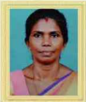
മാമന കെ. ടി FHC കടവൂർ എറണാകുളം ജില്ല