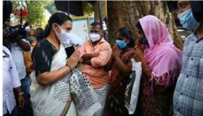
ആശ്വാസത്തിന്റെ കൂപ്പുകെട്ട്: ആശുപത്രിയിലെത്തിയ രോഗിയുമായി മന്ത്രി വീണാ ജോർജ് സംസാരിക്കുന്നു.