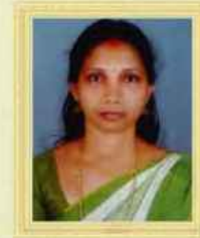
ചന്ദ്രിക FHC മങ്ങാട് കോഴിക്കോട് ജില്ല