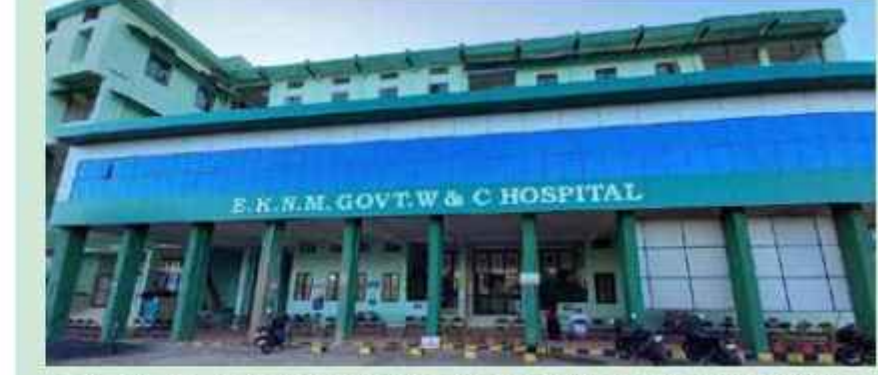
എൻ.കു.എ.എസ് സർട്ടിഫിക്കറ്റ് കരസ്ഥമാക്കിയ മാങ്ങാട്ടുപറമ്പ് സ്ത്രീകളുടെയും കുട്ടികളുടെയും ആശുപത്രി

കണ്ണൂർ: രാജ്യത്ത് ഏറ്റവുമധികം സ്ഥാപനങ്ങൾക്ക് നാഷണൽ ക്വാളിറ്റി അഷ്യൂറൻസ് സ്റ്റാൻ്റേർഡ്സ് (എൻ.കു.എ.എസ്) ലഭിച്ച ജില്ലയെന്ന നേട്ടം കരസ്ഥമാക്കി കണ്ണൂർ ജില്ല. ജില്ലയിലെ 26 ആരോഗ്യ സ്ഥാപനങ്ങൾക്കാണ് ഇതുവരെ എൻ.കു.എ.എസ് സർട്ടിഫിക്കറ്റ് ലഭിച്ചിട്ടുള്ളത്.