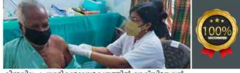
കിഴുവിലം പ്രാഥമികാരോഗ്യകേന്ദ്രത്തിൽ വാക്സിനേഷൻ നൽകുന്ന ആരോഗ്യ പ്രവർത്തക

തിരുവനന്തപുരം: കൊവിഡ് വകുപ്പോട് ചേർന്നാണ് സംസ്ഥാനത്ത് റിപ്പോർട്ട് ചെയ്ത സാഹചര്യത്തിൽ ജില്ലയിൽ വാക്സിനേഷൻ ഉൾക്കൊള്ളിയത്. അഞ്ചുതെങ്ങിലെ കിഴുവിലം ഗ്രാമപഞ്ചായത്തും പ്രാഥമികാരോഗ്യ കേന്ദ്രവും വാക്സിനേഷൻ പ്രവേശിപ്പിച്ചു. രണ്ട് ഡോസ് കൊവിഡ് വാക്സിനേഷൻ നൂറ് ശതമാനം പൂർത്തിയാക്കി. വാക്സിനേഷൻ ആരംഭിച്ച പതിനൊന്ന് മാസം പിന്നിടുമ്പോഴും രണ്ട് ഡോസും സ്വീകരിക്കാത്ത നിരവധി പേരാണ് പഞ്ചായത്തിലുണ്ടായിരുന്നത്. ഈ സാഹചര്യം വിലയിരുത്തിയാണ് പഞ്ചായത്തും കിഴുവിലം പ്രാഥമികാരോഗ്യ കേന്ദ്രവും സംയു