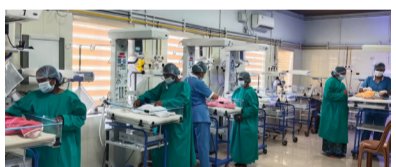
വയനാട് മെഡിക്കൽ കോളേജിൽ നവജാതശിശുക്കൾക്കായി ഒരുക്കിയിരിക്കുന്ന ആധുനിക സൗകര്യങ്ങൾ.

കൽപ്പറ്റ: സംസ്ഥാനത്തെ ഒരു സർക്കാർ ആശുപത്രിക്ക് കൂടി ദേശീയ ഗുണനിലവാര അംഗീകാരം. വയനാട് മെഡിക്കൽ കോളേജ് (മാനന്തവാടി ജില്ല ആശുപത്രി) 95 ശതമാനം സ്കോറോടെ മുസ്കാൻ സർട്ടിഫിക്കേഷൻ നേടിയെടുത്തു. നേരത്തെ കോഴിക്കോട് സർക്കാർ മെഡിക്കൽ കോളേജ് മാതൃശിശു സംരക്ഷണ കേന്ദ്രത്തിന് 96 ശതമാനം സ്കോറോടെ മുസ്കാൻ സർട്ടിഫിക്കേഷൻ ലഭിച്ചിരുന്നു. ഇതോടെ സംസ്ഥാനത്തെ 2 ആശുപത്രികൾക്ക് മുസ്കാൻ സർട്ടിഫിക്കേഷൻ ലഭിച്ചു. കൂടുതൽ ആശുപത്രികളെ ദേശീയ ഗുണനിലവാരത്തിലേക്ക് ഉയർത്താനാണ് ലക്ഷ്യമിടുന്നതെന്ന് ആരോഗ്യവകുപ്പ് മന്ത്രി വീണാ ജോർജ് വ്യക്തമാക്കി.