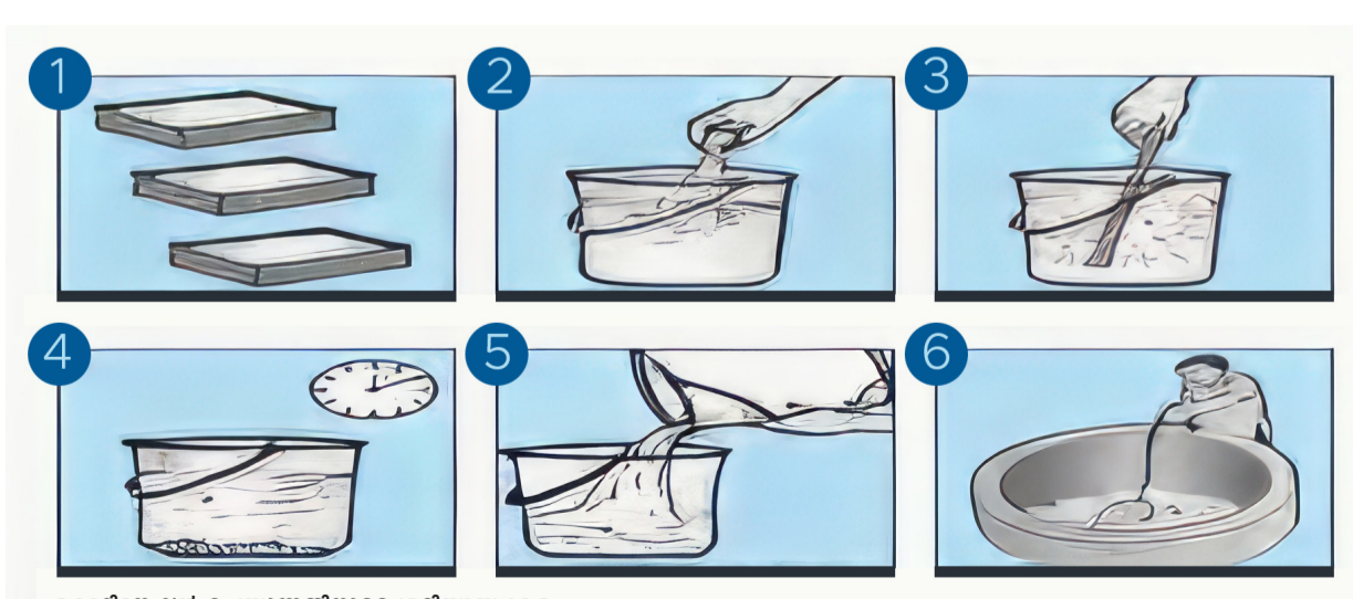
ക്ലോറിനേഷൻ ചെയ്യുന്നതിനുള്ള ശരിയായ ക്രമം

കിണറിലെ വെള്ളത്തിന്റെ അളവിനനുസരിച്ചു ബ്ലീച്ചിംഗ് പൗഡർ ഒരു ഹസ്റ്റിക് ബക്കറ്റിൽ എടുക്കുക. ഒരു കപ്പിൽ കുറച്ചു വെള്ളം എടുത്ത് ബ്ലീച്ചിംഗ് പൗഡറിലേക്ക് ഒഴിച്ചു വൃത്തിയുള്ള കമ്പു ഉപയോഗിച്ച് ഇളക്കി കൂടുമ്പു പരുവത്തിലാക്കുക. ഇതിലേക്ക് വീണ്ടും വെള്ളം ഒഴിച്ച് നന്നായി ഇളക്കി തെളിയാൻ വയ്ക്കുക. തെളിഞ്ഞ ബ്ലീച്ചിംഗ് ലായനി മാത്രം കിണറിലെ വെള്ളം കോരുന്ന ബക്കറ്റിലേക്ക് ഒഴിക്കുക. ഇത് പരമാവധി കിണറിലെ വെള്ളത്തിന്റെ അടിത്തട്ടു വരെ ഇറക്കി ശക്തിയായി ഉയർത്തുകയും താഴ്ത്തുകയും ചെയ്യുക. പലവട്ടം ഈ പ്രവർത്തി തുടരുക. ഒരു മണിക്കൂറിനു ശേഷം കിണറിലെ വെള്ളം ഉപയോഗിക്കാൻ തുടങ്ങാം.