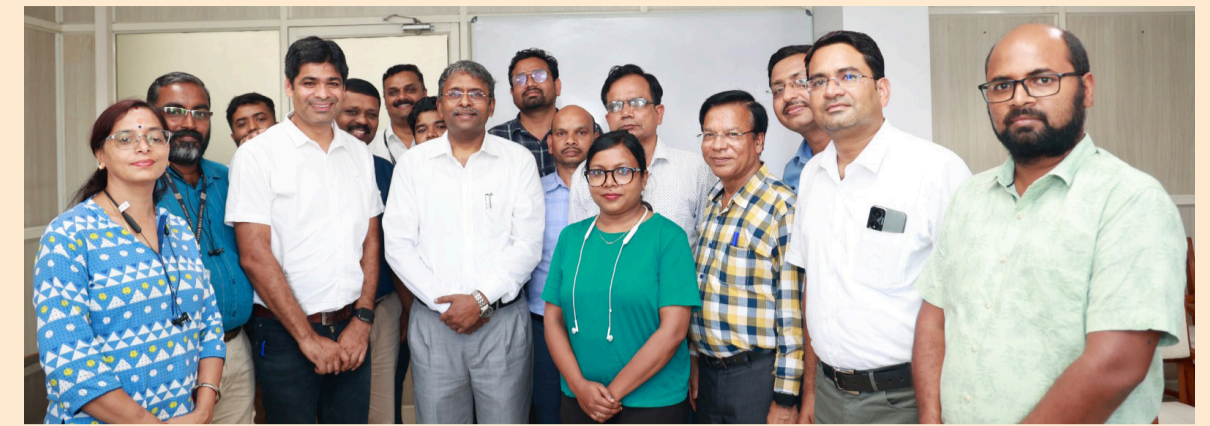
കേരളപാലിയേറ്റീവ് കെയർ പഠിക്കുവാനായി ചരത്തിസ്ഗഡിൽ നിന്നും തൊടുപുഴ ജില്ലാ ആശുപത്രിയിൽ എത്തിയ പ്രന്തന്മാർ സംഘം

കുട്ടികൾക്ക് പൊതുജനാരോഗ്യ കേന്ദ്രങ്ങളിൽ ഗുണനിലവാരമുള്ള ശിശു സൗഹൃദ സേവനങ്ങൾ ഉറപ്പാക്കുന്നതിനാണ് മുസ്കാൻ പദ്ധതിയിലൂടെ ലക്ഷ്യമിടുന്നത്. കുട്ടികളുടെ ശാരീരികവും മാനസികവും സാമൂഹികവുമായ വികാസം ഉൾപ്പെടെ വളർച്ചയുടെയും വികാസത്തിന്റെയും എല്ലാ സുപ്രധാന വശങ്ങളും ഇതിൽ ഉൾക്കൊള്ളുന്നു. എസ്.എൻ.സി.യു, എൻ.ബി.എസ്.യു, പ്രസവനന്തര വാർഡ്, പീഡിയാട്രിക് ഒ.പി.ഡി എന്നീ വിഭാഗങ്ങളുടെ ഗുണനിലവാരം മെച്ചപ്പെടുത്തുകയാണ് മുസ്കാൻ പദ്ധതിയിലൂടെ ലക്ഷ്യമിടുന്നത്. നാഷണൽ ക്വാളിറ്റി അഷുറൻസ് സ്റ്റാൻഡേർഡ്സിൽ (എൻ.ക്യു.എ.എസ്) ഏറ്റവും ഉയർന്ന സ്കോർ നേടിയ (99) മലപ്പുറം കോട്ടയ്ക്കൽ കുടുംബാരോഗ്യ കേന്ദ്രത്തെ അടൂത്തിടെ രാജ്യത്തെ മികച്ച പ്രാഥമികാരോഗ്യ കേന്ദ്രമായി തിരഞ്ഞെടുത്തിരുന്നു. സംസ്ഥാനത്ത് ഇതുവരെ ആകെ 175 ആശുപത്രികൾക്ക് എൻ.ക്യു.എ.എസ്. അംഗീകാരവും 76 ആശുപത്രികൾക്ക് പുന:അംഗീകാരവും ലഭിച്ചിട്ടുണ്ട്. ജനപ്രതിനിധികളുടെയും തദ്ദേശ സ്ഥാപനങ്ങളുടെയും സഹകരണത്തോടെ താലൂക്ക്, ജില്ലാ ആശുപത്രികളിൽ കൂടി ഗുണനിലവാരം ഉറപ്പാക്കാനായുള്ള പ്രവർത്തനങ്ങളാണ് നടന്നു വരുന്നത്.