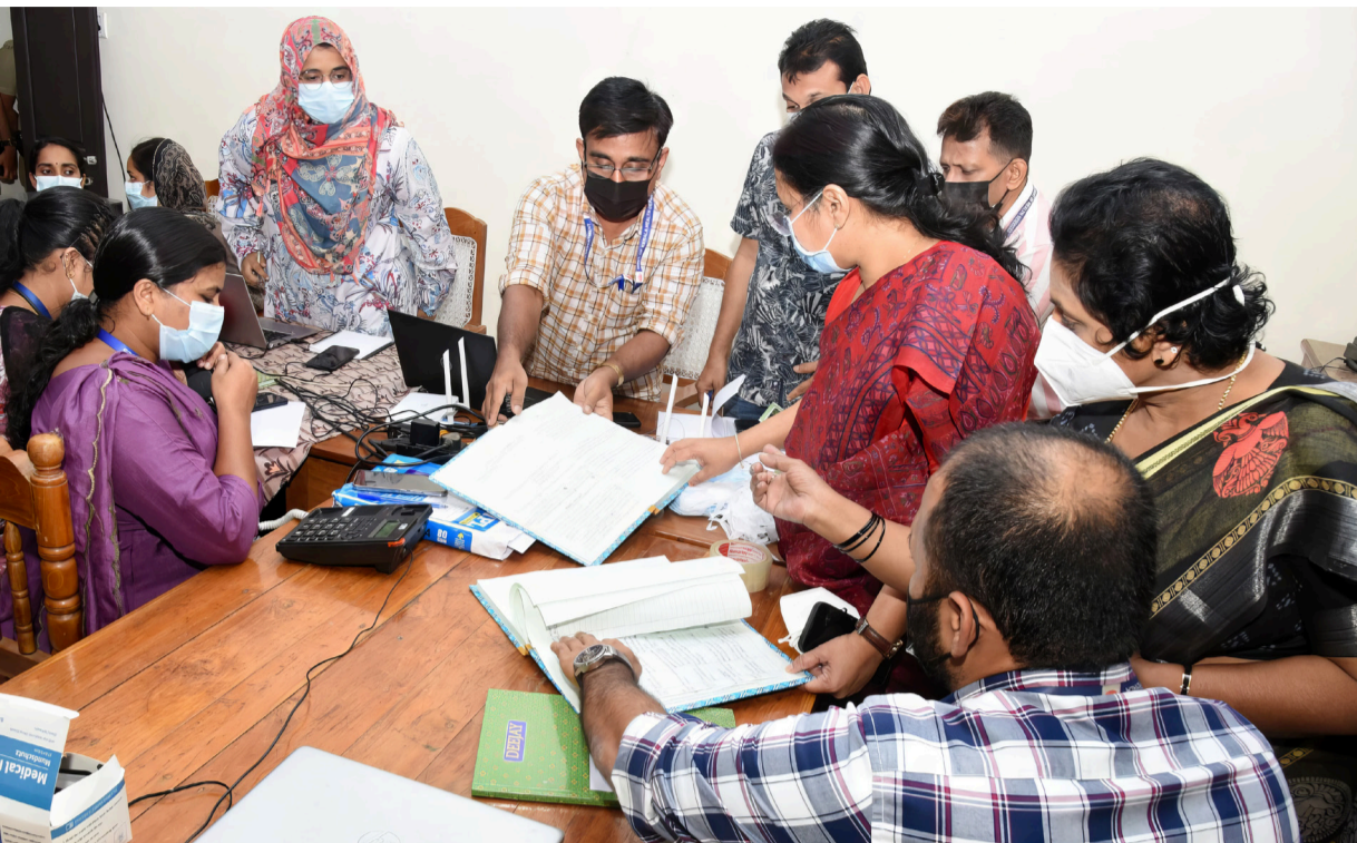
നിപ പ്രതിരോധത്തിന്റെ ഭാഗമായി മലപ്പുറം ജില്ലയിൽ ആരംഭിച്ച കൺട്രോൾ റൂം പ്രവർത്തനങ്ങൾക്ക് മന്ത്രി വീണാ ജോർജ് നേതൃത്വം കൊടുക്കുന്നു

നിർബന്ധമായും മാസ്ക് വക്കണമെന്ന് നിർദ്ദേശിക്കുകയും ചെയ്തു. ജില്ലയിൽ മഞ്ചേരി മെഡിക്കൽ കോളേജിലും കരുവാരകുണ്ട് സി.എച്ച്.സിയിലും ഐസൊലേഷൻ വാർഡുകൾ തയ്യാറാക്കി. രോഗികളെ ആശുപത്രിയിൽ എത്തിക്കുന്നതിനായി ആരോഗ്യവകുപ്പ് പ്രത്യേക ആംബുലൻസ് സേവനവും ഒരുക്കി. ഐസൊലേഷനിലുള്ളവർക്കാവശ്യമായ അവശ്യ സാധനങ്ങളെത്തിക്കുന്നതിന് വള്ളിയൂർമാരുടെ സേവനവുമൊരുക്കി. നിപ സ്ഥിരീകരിച്ച പഞ്ചായത്തിനു സമീപമുള്ള വണ്ടൂർ, നീലമ്പൂർ, കരുവാരകുണ്ട് എന്നിവിടങ്ങളിൽ പ്രത്യേക പനി ക്ലിനിക്കുകൾ ആരംഭിച്ചു. ആനക്കയം പാണ്ടിക്കാട് പഞ്ചായത്തുകളിലെ എല്ലാ വീടുകളിലും സർവ്വേ നടത്തി. ആ പ്രദേശങ്ങളിലെ പനിയുള്ളവരെ കണ്ടെത്തുകയും പ്രത്യേകം നിരീക്ഷിക്കുകയും ചെയ്തു. ജില്ലയിൽ പ്രതിരോധ പ്രവർത്തനങ്ങൾ ഏകോപിപ്പിക്കുന്നതിനായി കൺട്രോൾ സെൽ ആരംഭിക്കുകയും ചെയ്തു. 2018 മേയ് മാസത്തിലാണ് കേരളത്തിൽ ആദ്യമായി നിപ സ്ഥിരീകരിച്ചത്. അന്നു സ്വായത്തമാക്കിയ പ്രതിരോധ പ്രവർത്തനങ്ങളുടെ ഊർജ്ജവും മാർഗ്ഗങ്ങളും ഉൾക്കൊണ്ടു