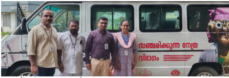
സഞ്ചരിക്കുന്ന നേത്ര രോഗ വിഭാഗം

ആലപ്പുഴ : ജനറൽ ആശുപത്രിയിൽ ദേശീയ അന്യത നിവാരണ നിയന്ത്രണ പരിപാടിയുടെ ഭാഗമായി 2022 ഒക്ടോബർ മുതൽ 2024 ജൂൺ വരെ 514 തിമിര ശസ്ത്രക്രിയകൾ പൂർത്തിയാക്കി. 'നയനപഥം' എന്ന പേരിൽ സഞ്ചരിക്കുന്ന നേത്ര രോഗ വിഭാഗം, കാഴ്ച പരിമിതരെ കണ്ടെത്തി സൗജന്യ ചികിത്സ നൽകുന്നതാണ്