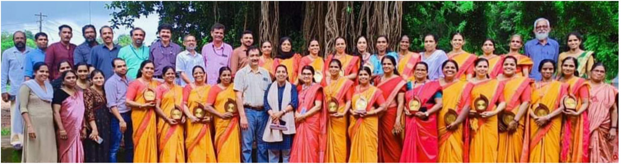
വിളർച്ച പരിശോധന 100% പൂർത്തിയാക്കിയ പിലിക്കോട് പഞ്ചായത്തിലെ ആരോഗ്യ പ്രവർത്തകർ

ജനകീയ കൂട്ടായ്മയിലൂടെ മുൻകാലങ്ങളിൽ ശുചിത്വ മേഖലയിലും ഊർജ്ജ സംരക്ഷണ മേഖലയിലും രാജ്യത്തിനാകെ മാതൃകയായ പ്രവർത്തനങ്ങൾ ഏറ്റെടുത്ത ഗ്രാമപഞ്ചായത്ത്