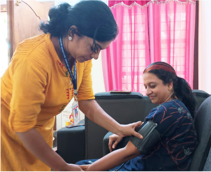
കിളിമാനൂർ ബ്ലോക്ക് പഞ്ചായത്ത് നടപ്പാക്കുന്ന ജനകീയ ലാബിലൂടെ പരിശോധന നടത്തുന്നു

തിരുവനന്തപുരം: ആരോഗ്യരംഗത്തെ നേട്ടങ്ങളാണ് കേരള മോഡൽ വികസനത്തിന്റെ ആണിക്കല്ല് ആരോഗ്യ സുചികകളുടെ കാര്യത്തിൽ കേരളം ഇപ്പോഴും ഒന്നാംസ്ഥാനം നിലനിർത്തുന്നു. മുതലായ, കേരളത്തിനോട് അടുത്തേക്കില്ലാത്തതായ സംസ്ഥാന