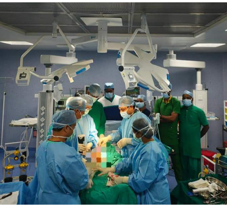
വൈത്തിരി സ്വദേശിയായ 64 -കാരിക്ക് താലൂക്ക് ആശുപത്രിയിൽ മുട്ടു മാറ്റിവെക്കൽ ശസ്ത്രക്രിയ നടത്തുന്നു

കൽപ്പറ്റ: മുട്ട് തേയ്മാനത്തിനുള്ള ശാശ്വത ചികിത്സയായ മുട്ടുമാറ്റിവെക്കൽ ശസ്ത്രക്രിയ വൈത്തിരി താലൂക്ക് ആസ്ഥാന ആശുപത്രിയിൽ വിജയകരമായി പൂർത്തിയാക്കി. ഏറെ നാളായി മുട്ടുവേദന കൊണ്ട് ദുരിതമനുഭവിക്കുന്ന വൈത്തിരി സ്വദേശിയായ 64കാരിയാണ് ശസ്ത്രക്രിയ നടത്തിയത്. എല്ല് തേയ്മാനത്തിന്റെ