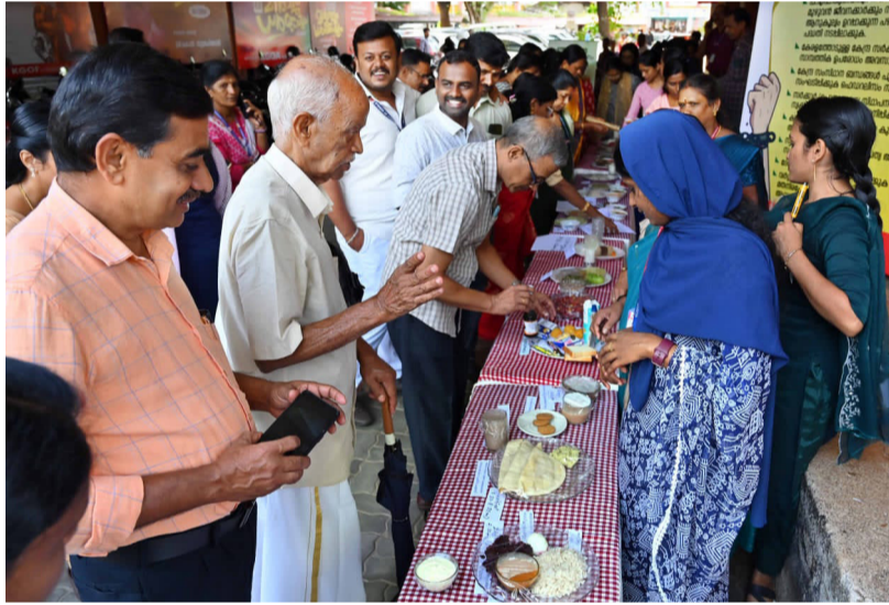
പോഷകാഹാര വാരത്തോടനുബന്ധിച്ച് പാലക്കാട് സിവിൽ സ്റ്റേഷനിലെ ജീവനക്കാർക്കായി സംഘടിപ്പിച്ച എക്സിബിഷൻ

പാലക്കാട്: പോഷകാഹാര വാരത്തോടനുബന്ധിച്ച് പാലക്കാട് സിവിൽ സ്റ്റേഷനിലെ ജീവനക്കാർക്കായി എക്സിബിഷനും ബോധവൽക്കരണ ക്ലാസും സംഘടിപ്പിച്ചു. ജില്ലയിലെ വിവിധ ആരോഗ്യ സ്ഥാപനങ്ങളിലെ ഡയറ്റിഷ്യൻമാരുടെ നേതൃത്വത്തിൽ സമീകൃത ആഹാരക്രമം, പ്രമേഹ രോഗികൾക്കും അമിതവണ്ണം ഉള്ളവർക്കും പോഷകാഹാര കുറവുള്ളവർക്കുമുള്ള ഭക്ഷണക്രമം എന്നിങ്ങനെയാണ് പ്രദർശനം സംഘടിപ്പിച്ചത്. അമിതമായ കൊഴുപ്പടങ്ങിയതും കൃത്രിമ ചേരുവകൾ ഉള്ളവയുമായ ആഹാരങ്ങളുടെ അമിത ഉപയോഗവും ഭക്ഷണക്രമത്തിലെ അവശ്യ പോഷകങ്ങളുടെ അപര്യാപ്തതയും വ്യായാമ കുറവും ഉണ്ടാകുന്ന ആരോഗ്യ പ്രശ്നങ്ങളും പ്രതിപാദിക്കുന്ന ബോ