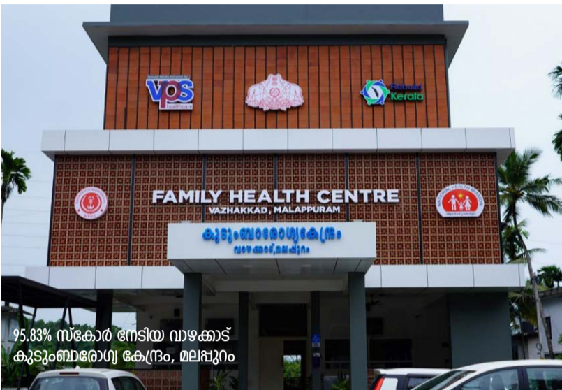
95.83% സ്കോർ നേടിയ വാഴക്കാട് കുടുംബാരോഗ്യ കേന്ദ്രം, മലപ്പുറം

ആകെ 187 ആശുപത്രികൾക്ക് എൻ.കു.എ.എസ് ♦ 12 ആശുപത്രികൾക്ക് ലക്ഷ്യ സർട്ടിഫിക്കേഷൻ