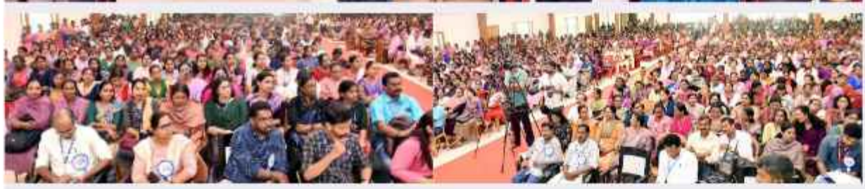
100 ദിവസ കുടുംബാരോഗ്യ നിവാരണ തീവ്ര ബോധവൽക്കരണ ക്യാമ്പയിൻ: വിവിധ ജില്ലകളിൽ നടന്ന പരിപാടികൾ