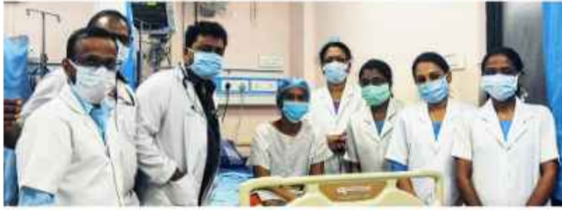
സെപ്റ്റിക് ഷോക്കിൽ നിന്നും ചികിത്സയും പരിചരണവും നൽകി ജീവൻ രക്ഷിച്ച കുറ്റിപ്പുറം താലൂക്ക് ആശുപത്രിയിലെ ജീവനക്കാർ വിദ്യാർത്ഥിനിയ്ക്കൊപ്പം

പി.എച്ച്.ഡി. വിദ്യാർത്ഥിനിയ്ക്ക് കരുതലേകി കുറ്റിപ്പുറം താലൂക്ക് ആശുപത്രി