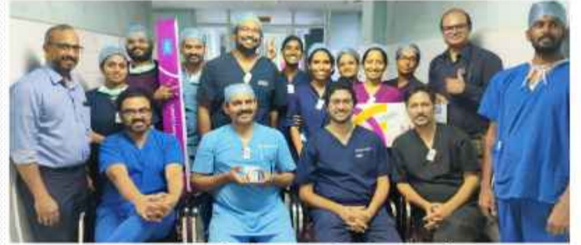
ഹൃദയം തുറക്കാതെ വാൽവ് മാറ്റിവെച്ച് എഴുപത്തിനാല് വയസുകാരിയെ ജീവിതത്തിലേക്ക് തിരികെയെത്തിച്ച തൃശൂർ മെഡിക്കൽ കോളേജ് ടീം

എഴുപത്തിനാല് വയസുകാരിയെ ജീവിതത്തിലേക്ക് തിരികെയെത്തിച്ചു