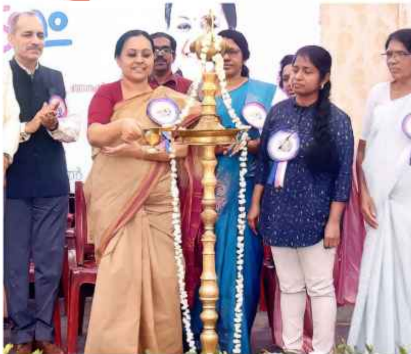
കുടുംബാരോഗ്യ നിവാരണ ബോധവൽക്കരണ ക്യാമ്പയിൻ സംസ്ഥാനതല ഉദ്ഘാടനം ആരോഗ്യ, വനിതാ ശിശു വികസന വകുപ്പ് മന്ത്രി വീണാ ജോർജ് ഉദ്ഘാടനം ചെയ്യുന്നു.

പത്തനംതിട്ട: ആരോഗ്യവകുപ്പ്, തദ്ദേശ സ്വയംഭരണ സ്ഥാപനങ്ങൾ, ജില്ലാ ഭരണകൂടം തുടങ്ങി വിവിധ വകുപ്പുകളുടെ കൂട്ടായ പ്രവർത്തനത്തിലൂടെ കുടുംബാരോഗ്യമുക്ത കേരളം എന്ന ലക്ഷ്യം നേടുമെന്ന് ആരോഗ്യ, വനിതാ ശിശുവികസന വകുപ്പ് മന്ത്രി വീണാ ജോർജ്. കുടുംബാരോഗ്യ നിവാരണ പ്രവർത്തനങ്ങൾക്ക് ശക്തി പകരാനുള്ള 100 ദിവസത്തെ തീവ്രബോധവൽക്കരണ ക്യാമ്പയിൻ സംസ്ഥാനതല ഉദ്ഘാടനം ഇലത്തൂർ പെട്രോൾ കൺവൻഷൻ സെന്ററിൽ നിർവഹിക്കുകയായിരുന്നു മന്ത്രി.