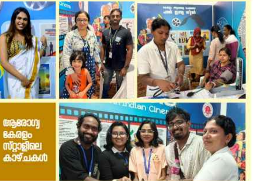
ആരോഗ്യ കേരളം സ്റ്റാളിലെ കാഴ്ചകൾ