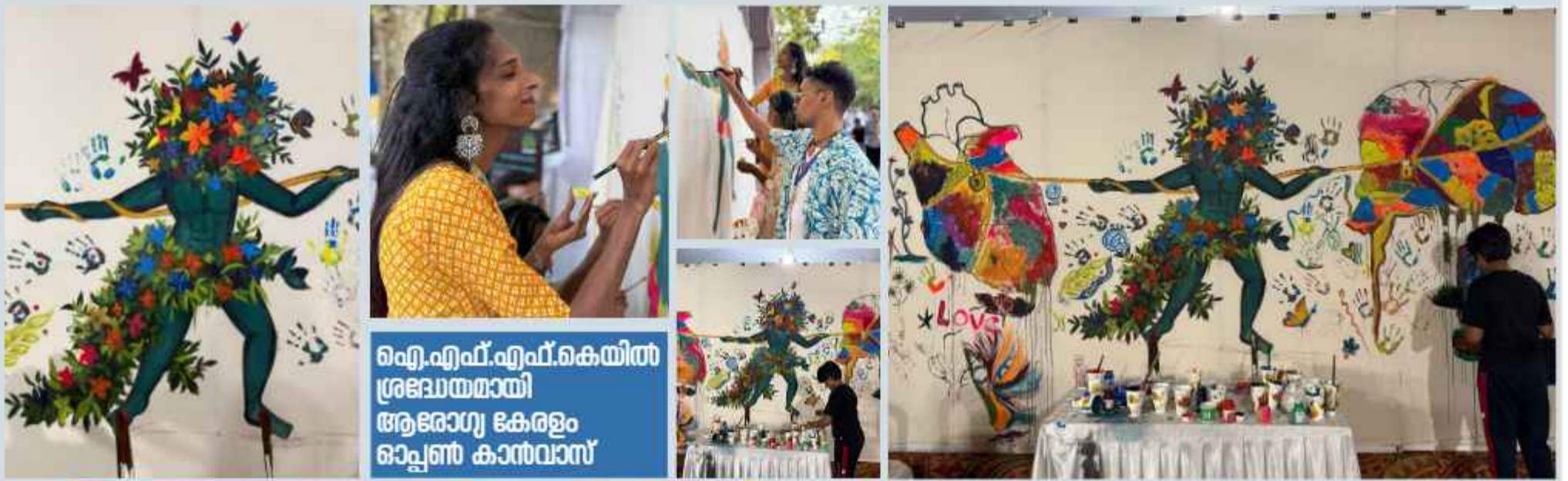
ഐ.എഫ്.എഫ്.കെയിൽ ശ്രദ്ധയമായി ആരോഗ്യ കേരളം ഓപ്പൺ കാൻവാസ്