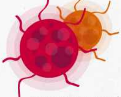
ഇത്തരം അപകടാവസ്ഥകൾ കുടാതെ മറ്റു പല സങ്കീർണ്ണതകളും

അണുബാധ പ്രസവത്തോടനുബന്ധിച്ച് അമ്മയ്ക്കും കുഞ്ഞിനും ഉണ്ടാകാൻ സാധ്യതയുള്ള അണുബാധ തടയുന്നത് വളരെ പ്രധാനമാണ്. അതിനായി പ്രസവമുറിയും അനുബന്ധ ഉപകരണങ്ങളും അണുവിമുക്തമായി സൂക്ഷിക്കേണ്ടത് വളരെ പ്രധാനമാണ്. അമ്മയ്ക്കോ കുഞ്ഞിനോ അണുബാധയുണ്ടായാൽ യഥാസമയം ഫലപ്രദമായ ചികിത്സനൽകാൻ സാധിച്ചില്ലെങ്കിൽ ആന്തരിക അവയവങ്ങളുടെ പ്രവർത്തനം തടസ്സപ്പെടുകയും മരണം വരെ സംഭവിക്കാനും കാരണമാകുന്നു. ആശുപത്രികളിൽ ഇവ കൈകാര്യം ചെയ്യാൻ ഫലപ്രദമായ സംവിധാനങ്ങളുണ്ട്. എന്നാൽ വീട്ടിൽ പ്രസവിക്കുന്ന സാഹചര്യത്തിൽ ഇത്തരം സങ്കീർണ്ണതകൾ ഒഴിവാക്കാൻ പലപ്പോഴും സാധിക്കാതെ വരും.