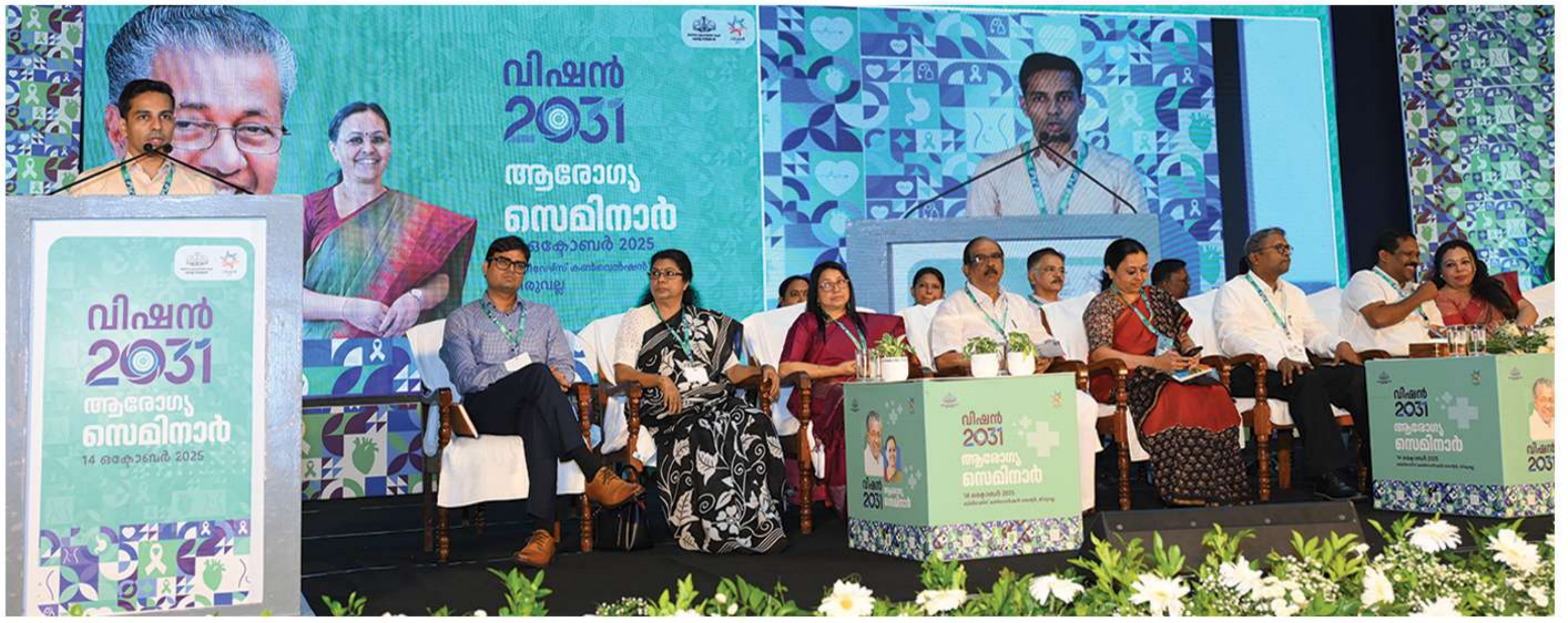
2031ൽ കേരള സംസ്ഥാനം രൂപീകരിച്ചിട്ട് 75 വർഷം പൂർത്തിയാകുന്നതിനാൽ കഴിഞ്ഞകാല വളർച്ചയും, ഭാഷാവികസനവും ചർച്ച ചെയ്യുന്നതിനായി സംഘടിപ്പിക്കപ്പെട്ട സെമിനാറുകളുടെ ഭാഗമായ ആരോഗ്യ സെമിനാർ തിരുവല്ല ബിലീവേഴ്സ് കൺവെൻഷൻ സെന്ററിൽ നടന്നു.

ക്രിയാത്മക നിർദ്ദേശങ്ങൾ നിറഞ്ഞതായിരുന്നു ചർച്ചാവേദികൾ. പകർച്ചവ്യാധി പ്രതിരോധത്തിന് ശുചിത്വം ഉറപ്പാക്കാൻ സാക്ഷരതാ മിഷൻ പോലെ ക്യാമ്പയിൻ ആണ് ചർച്ചയിലെ പ്രധാന ആശയം. ഗവേഷണത്തിന് കൃത്യമായ നയവും മാനദണ്ഡങ്ങളും ഉണ്ടായിരിക്കണം, ഏകീകൃത ആരോഗ്യ ഗവേഷണ ചട്ടക്കൂട് സ്ഥാപിക്കുക, കേരള ഗവേഷണ പ്രൊമോഷൻ പോർട്ടൽ, ഡാറ്റയും വൈദഗ്ധ്യവും ശേഖരിക്കുന്നതിനുള്ള നിർദ്ദിഷ്ട കൺസോർഷ്യം, മെഡിക്കൽ കോളേജുകളിൽ തൃതീയ പരിചരണം ശാക്തീകരിക്കുക, റഫറൽ നെറ്റ് വർക്ക് ശക്തിപ്പെടുത്തുക, ഇന്റർസീവ് കെയർ ശാക്തീകരണം, ഡിജിറ്റൽ ഹെൽത്ത് ആൻഡ് ടെലിമെഡിസിൻ, ഐഎ സഹായത്തോടെയുള്ള ഡയഗ്നോസ്റ്റിക്സ്, പോയിന്റ് ഓഫ് കെയർ ഡയഗ്നോസ്റ്റിക്സ്, താങ്ങാനാവുന്ന സാമൂഹിക സുരക്ഷാ പദ്ധതികൾ അവതരിപ്പിച്ചുകൊണ്ട് സാർവത്രിക ആരോഗ്യ കവരേജ്, ദീർഘകാല രോഗങ്ങൾക്ക് സബ്സിഡി മരുന്നുകൾ, ആരോഗ്യ പാക്കേജുകളും സേവന നിരക്കുകളും മാനദണ്ഡമാക്കുക, ക്യാൻസർ പ്രതിരോധവും രോഗ നിർണ്ണയവും ശക്തിപ്പെടുത്തുക, ക്യാൻസർ പരിചരണത്തിന്റെ വികേന്ദ്രീകരണം, വയോജന പരിചരണത്തിലെ മികവിനുള്ള കേന്ദ്രം, കോഴിക്കോട് ഓർഗൻ ട്രാൻസ്പ്ലാന്റ് ഇൻസ്ട്രിറ്റ്യൂട്ടിലെ റോബോട്ടിക്സ്, എല്ലാ ജില്ലകളിലെയും ദക്ഷ്യ സുരക്ഷാ