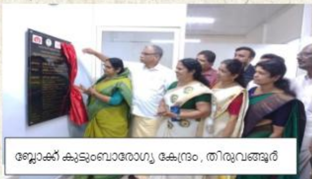
ബ്ലോക്ക് കുടുംബാരോഗ്യ കേന്ദ്രം, തിരുവങ്ങൂർ