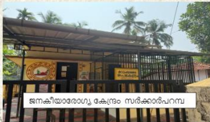
ജനകീയാരോഗ്യ കേന്ദ്രം സരിക്കാരിപറമ്പ്