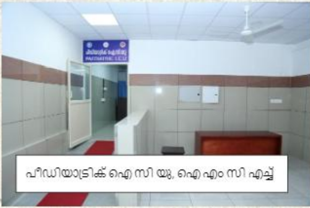
പീഡിയാട്രിക് ഐ സി യു, ഐ എം സി എച്ച്