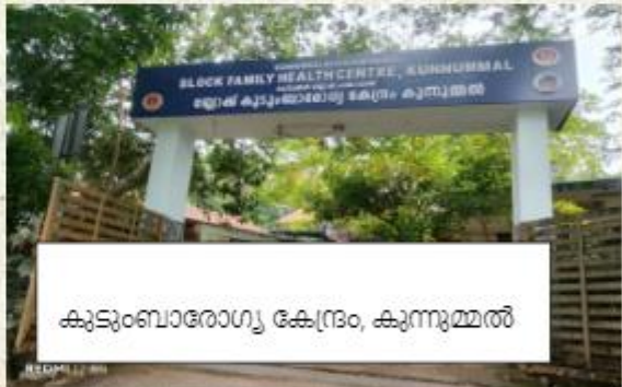
കുടുംബാരോഗ്യ കേന്ദ്രം, കുന്നുമ്മൽ