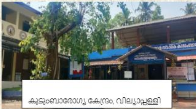
കുടുംബാരോഗ്യ കേന്ദ്രം, വിലയാപ്പള്ളി