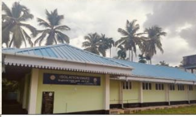
ഐസൊലേഷൻ വാർഡ്, സി എച്ച് സി ഓർക്കാട്ടേരി