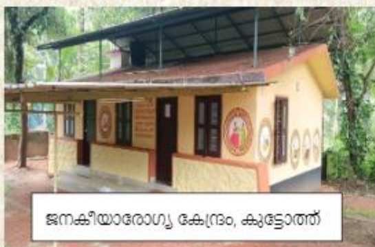
ജനകീയാരോഗ്യ കേന്ദ്രം, കുളോത്ത്