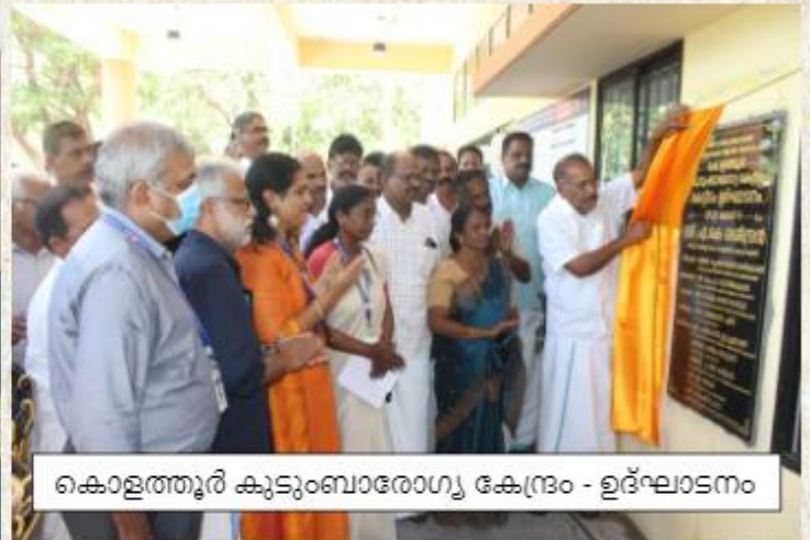
കൊളത്തൂർ കുടുംബാരോഗ്യ കേന്ദ്രം - ഉദ്ഘാടനം