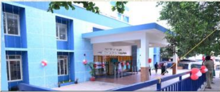
സ്ത്രീകളുടെയും കുട്ടികളുടെയും വിഭാഗം - ജില്ലാ ആശുപത്രി വടകര