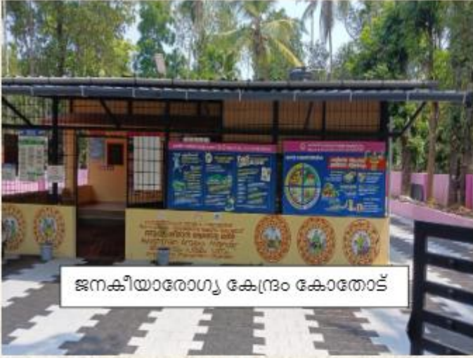
ജനകീയാരോഗ്യ കേന്ദ്രം കോതോട്