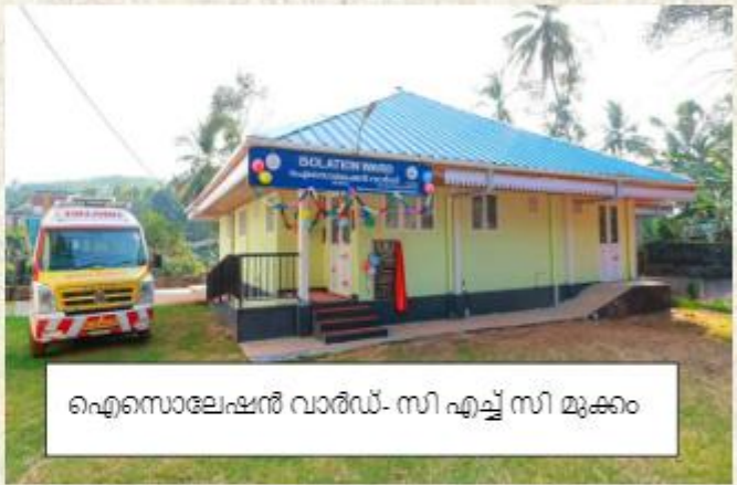
ഐസൊലേഷൻ വാർഡ്- സി എച്ച് സി മുക്കം