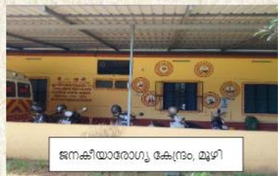
ജനകീയാരോഗ്യ കേന്ദ്രം, മുഴി