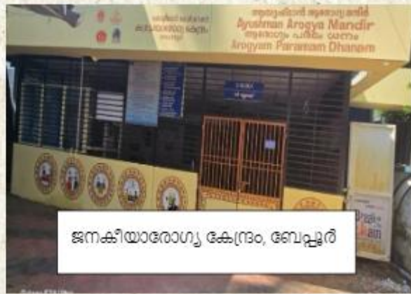
ജനകീയാരോഗ്യ കേന്ദ്രം, ബേപ്പൂർ