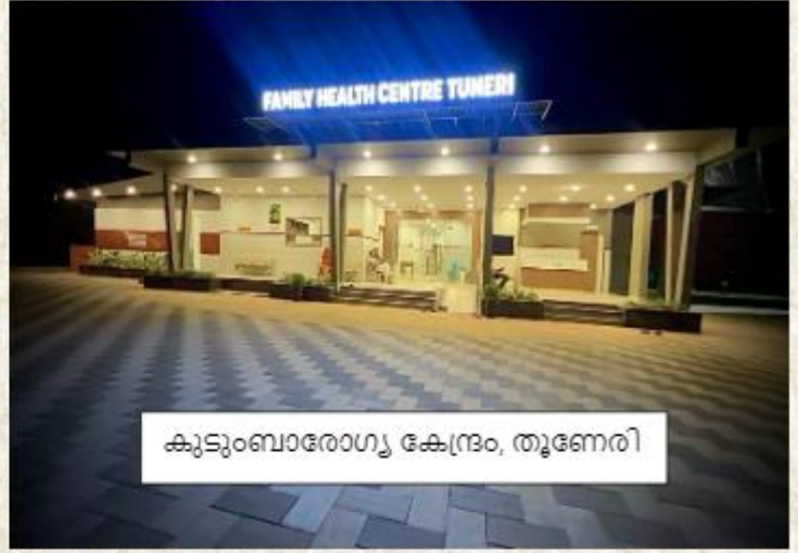
കുടുംബാരോഗ്യ കേന്ദ്രം, തൂണേരി