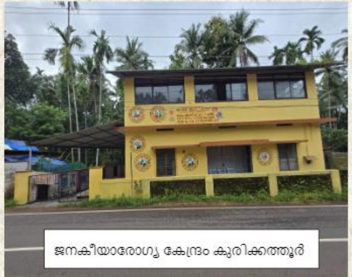
ജനകീയാരോഗ്യ കേന്ദ്രം കുരിക്കത്തൂർ