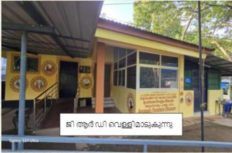
ജി ആർ ഡി വെള്ളിമാടുകുന്ന്