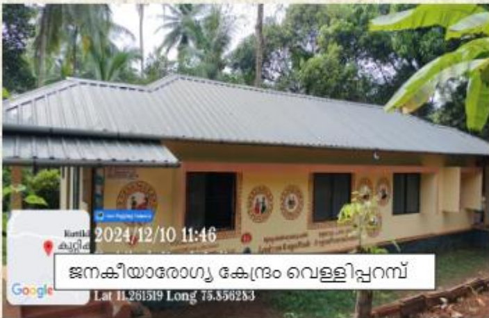
ജനകീയാരോഗ്യ കേന്ദ്രം വെള്ളിപ്പറമ്പ്