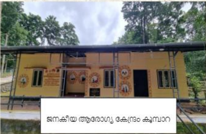
ജനകീയ ആരോഗ്യ കേന്ദ്രം കുമ്പാറ