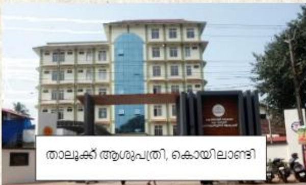
താലൂക്ക് ആശുപത്രി, കൊയിലാണ്ടി

പതിനഞ്ചാം ധനകാര്യ കമ്മീഷൻ ഹെൽത്ത് ഗ്രാന്റ് ഉപയോഗിച്ച് പയ്യോളി മുൻസിപ്പാലിറ്റി കീഴിൽ അയനിക്കാട്, പയ്യോളി ബീച്ച്, പയ്യോളി ടൗൺ എന്നിവിടങ്ങളിലും കൊയിലാണ്ടി മുനിസിപ്പാലിറ്റിക്ക് കീഴിൽ കൊയിലാണ്ടി സൗത്ത്, കൊല്ലം, പെരുവട്ടൂർ എന്നിവിടങ്ങളിലും ഓരോ നഗര ജനകീയ ആരോഗ്യ കേന്ദ്രം വീതം ആരംഭിച്ചു.