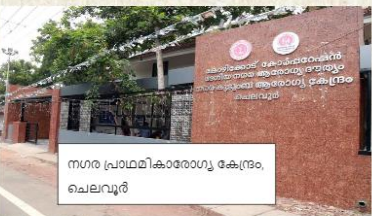
നഗര പ്രാഥമികാരോഗ്യ കേന്ദ്രം, ചെലവൂർ