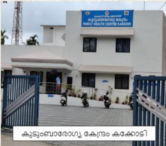
കുടുംബാരോഗ്യ കേന്ദ്രം കക്കോടി