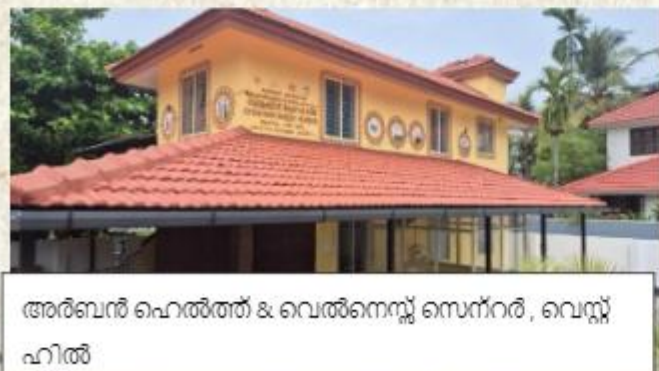
അർബൽ ഹെൽത്ത് & വെൽനെസ്സ് സെന്റർ, വെല്ല ഹിൽ