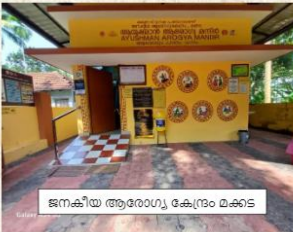
ജനകീയ ആരോഗ്യ കേന്ദ്രം മക്കട