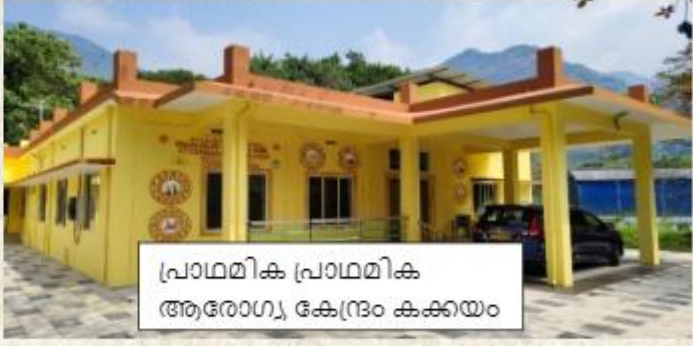
പ്രാഥമിക പ്രാഥമിക ആരോഗ്യ കേന്ദ്രം കക്കയം