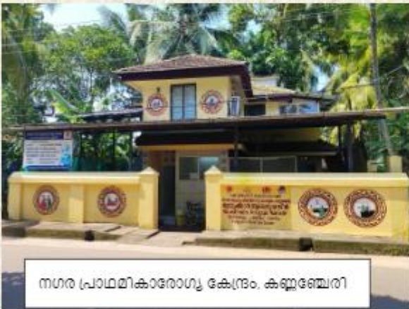
നഗര പ്രാഥമികാരോഗ്യ കേന്ദ്രം, കണ്ണഞ്ചേരി