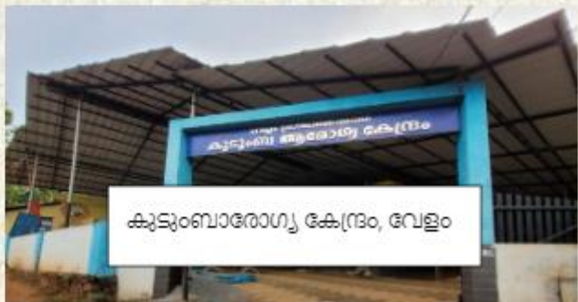
കുടുംബാരോഗ്യ കേന്ദ്രം, വേളം