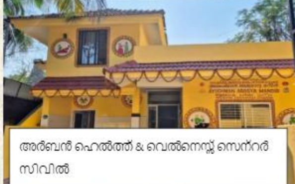
അർബൽ ഹെൽത്ത് & വെൽനെസ്സ് സെന്റർ സിവിൽ