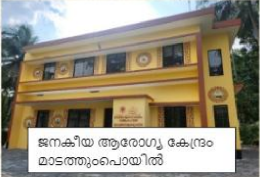
ജനകീയ ആരോഗ്യ കേന്ദ്രം മാടത്തുംപൊയിൽ