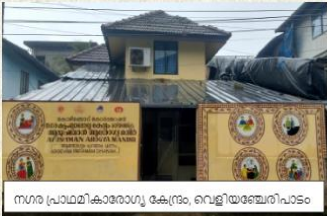
നഗര പ്രാഥമികാരോഗ്യ കേന്ദ്രം, വെളിയഞ്ചേരിപാടം