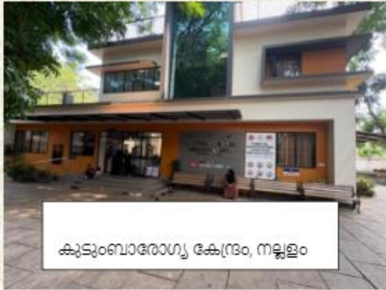
കുടുംബാരോഗ്യ കേന്ദ്രം, നല്ലൂർ