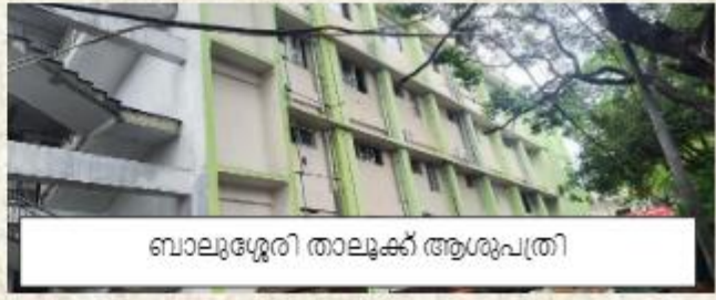
ബാലുശ്ശേരി താലൂക്ക് ആശുപത്രി