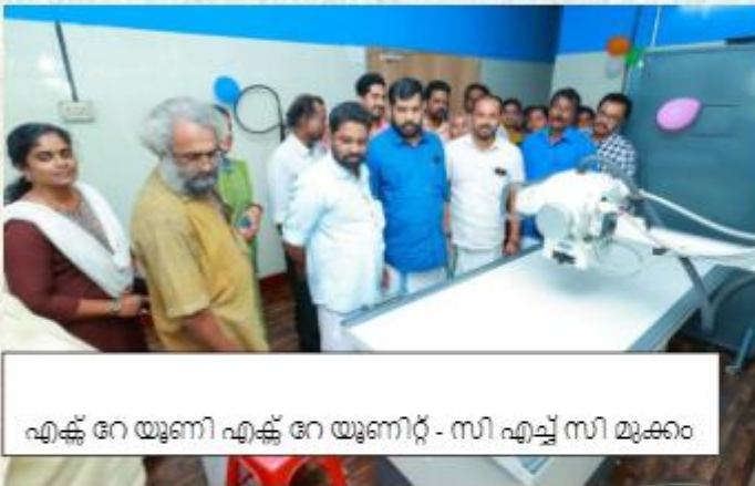
എക്സ് നേ യൂണി എക്സ് നേ യൂണിറ്റ് - സി എച്ച് സി മുക്കം