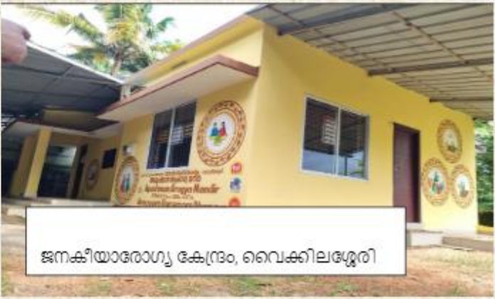
ജനകീയാരോഗ്യ കേന്ദ്രം, വൈക്കിലശ്ശേരി