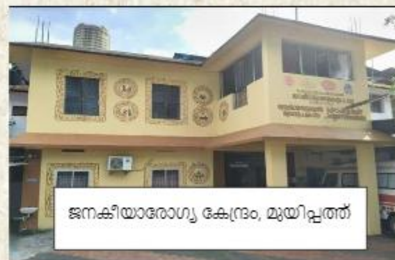
ജനകീയാരോഗ്യ കേന്ദ്രം, മുയിപ്പത്ത്