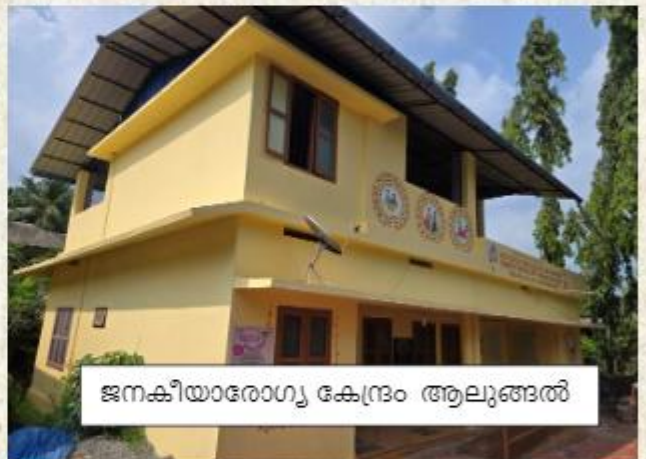
ജനകീയാരോഗ്യ കേന്ദ്രം ആലുങ്ങൽ