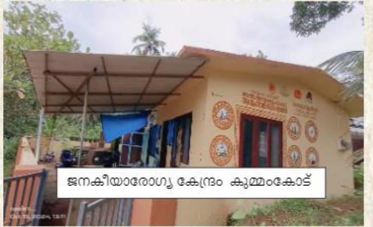
ജനകീയാരോഗ്യ കേന്ദ്രം കുമ്മംകോട്