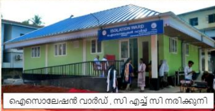
ഐസൊലേഷൻ വാർഡ്, സി എച്ച് സി നരിക്കുനി