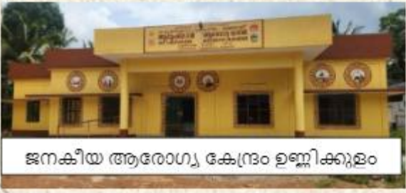
ജനകീയ ആരോഗ്യ കേന്ദ്രം ഉണ്ണിക്കുളം