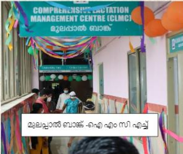
മൂലപ്പാൽ ബാങ്ക് -ഐ എം സി എച്ച്