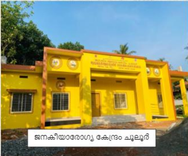
ജനകീയാരോഗ്യ കേന്ദ്രം ചൂലൂർ