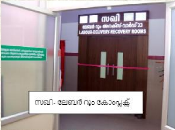
സബി- ലേബർ റൂം കോംപ്ലക്സ്