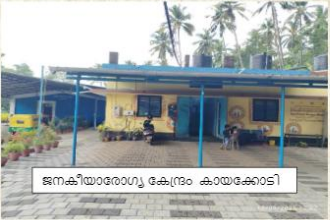
ജനകീയാരോഗ്യ കേന്ദ്രം കായക്കോടി