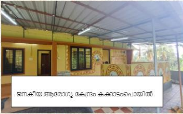
ജനകീയ ആരോഗ്യ കേന്ദ്രം കക്കാടംപൊയിൽ