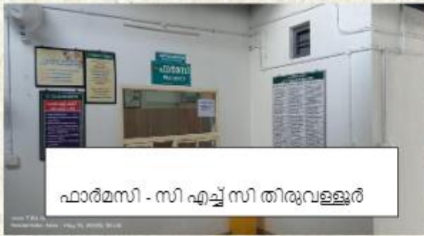
ഫാർമസി - സി എച്ച് സി തിരുവള്ളൂർ