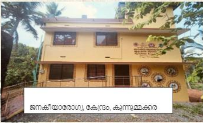
ജനകീയാരോഗ്യ കേന്ദ്രം, കുഞ്ഞുമ്മക്കര