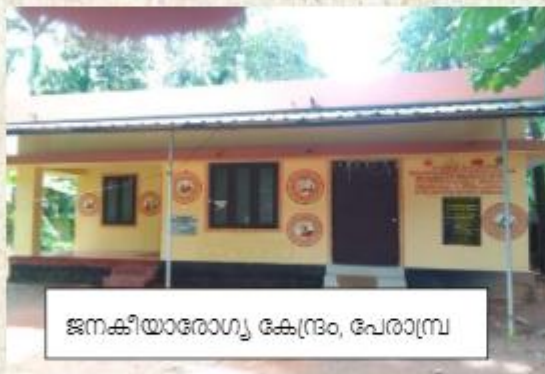
ജനകീയാരോഗ്യ കേന്ദ്രം, പേരാമ്പ്ര