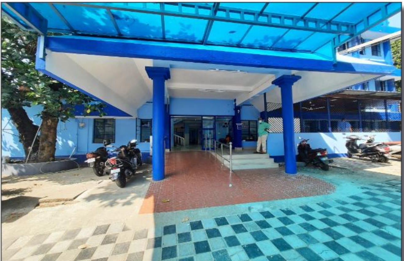
തവീകരിച്ച ഒപി യുടെ ജന്മവാസം - താലൂക്കാസ്ഥാന ആശുപത്രി