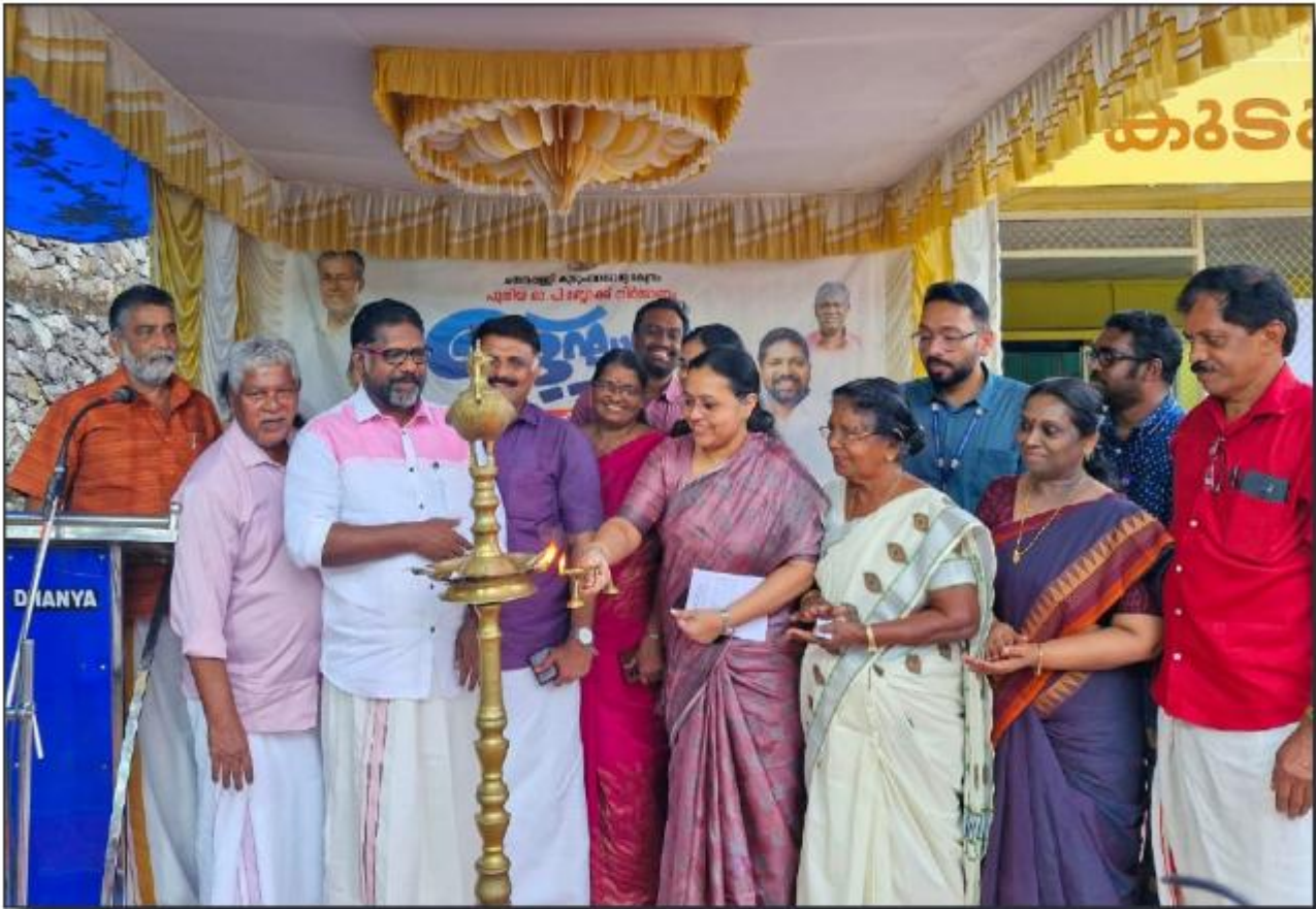
ചന്ദനപ്പള്ളി കുടുംബാരോഗ്യകേന്ദ്രം - പുതിയ കെട്ടിടത്തിന്റെ തീർമ്മാണോദ്ഘാടനം