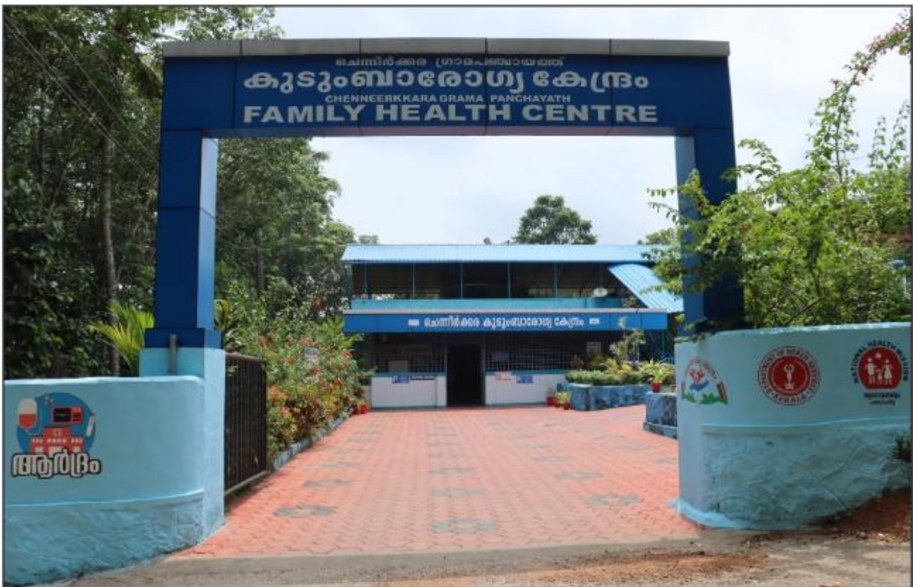
ദേശീയ ഗുണനിലവാര അംഗീകാരം (NQAS) ലഭിച്ച ചെന്നീർക്കര കുടുംബാരോഗ്യകേന്ദ്രം