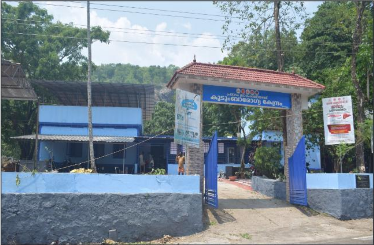
പ്രദേശ പ്രാഥമികാരോഗ്യകേന്ദ്രത്തെ കുടുംബാരോഗ്യകേന്ദ്രമായി ഉയർത്തി