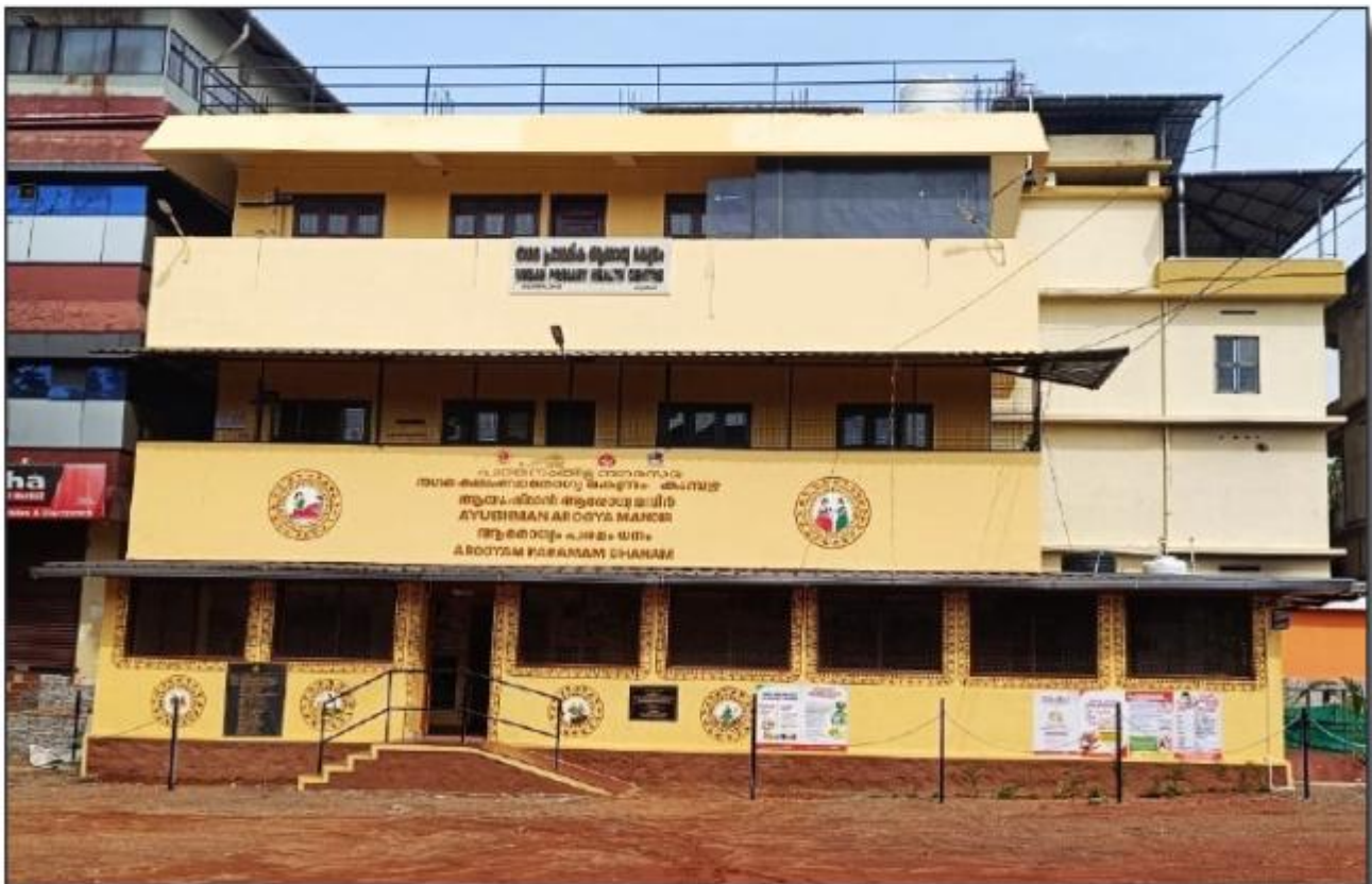
കുന്യാ നഗര കുടുംബാരോഗ്യകേന്ദ്രം - ദേശീയ ഗുണനിലവാര അംഗീകാരം (NQAS) ലഭിച്ചു.