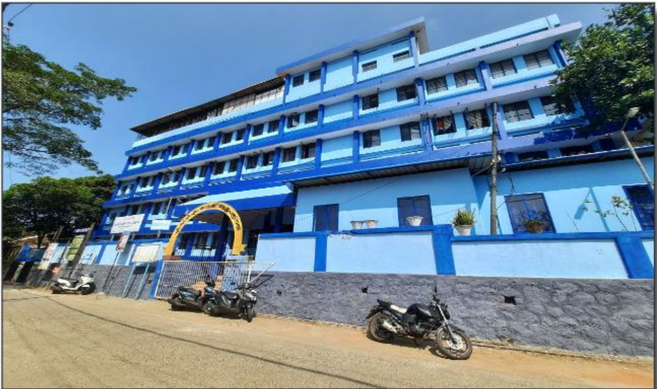
കിഫ്ബി പദ്ധതിയിൽ ഉൾപ്പെടുത്തി റാന്നി താലൂക്കാഭ്യന്തരയിൽ പുതിയ കെട്ടിടം നിർമ്മിക്കുന്നതിനും സ്ഥലം ഏറ്റെടുക്കലിനുമായി 17.137 കോടി രൂപ അനുവദിച്ചു.