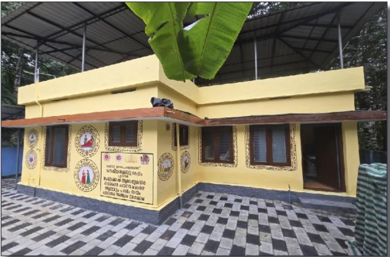
ജനകീയാ ആരോഗ്യകേന്ദ്രം പാണിത്