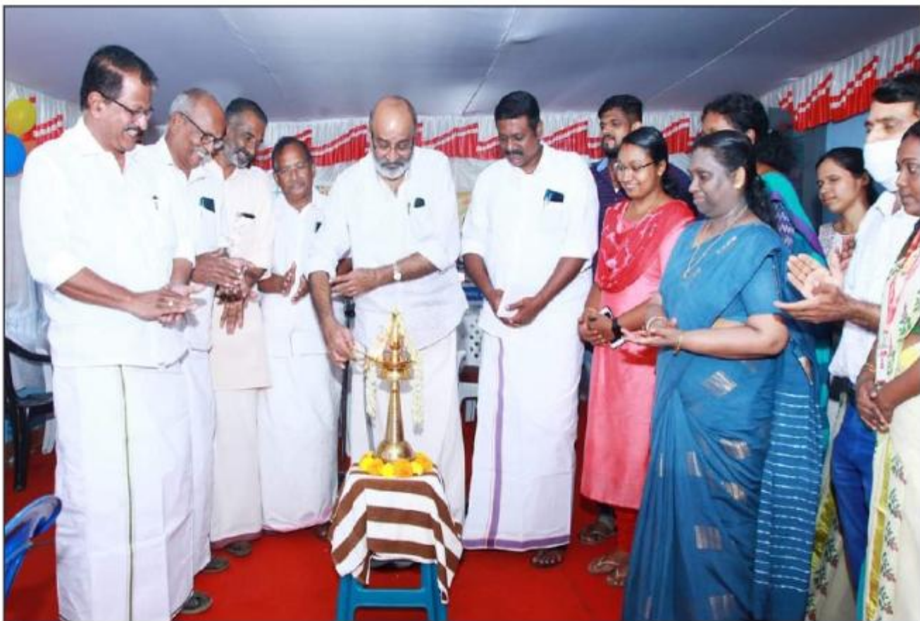
കുറ്റൂർ പ്രാഥമികാരോഗ്യകേന്ദ്രത്തെ കുടുംബാരോഗ്യകേന്ദ്രമാക്കി ഉയർത്തുന്നു.