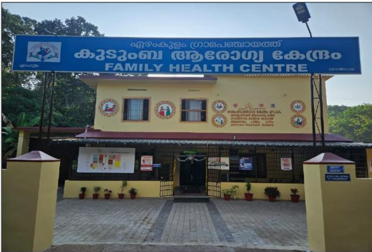
എഴുംകുളം കുടുംബാരോഗ്യകേന്ദ്രം - NQAS ദേശീയ അംഗീകാരത്തിന്റെ തിരിവിൽ