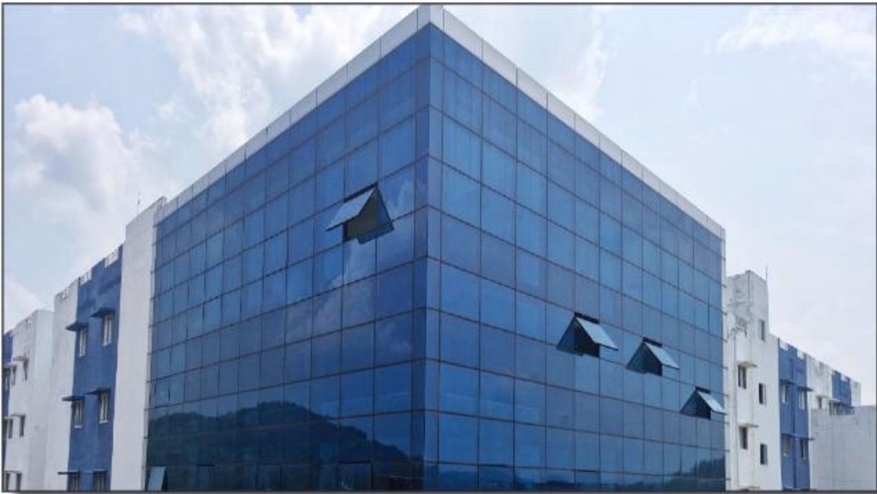
കോന്നി മെഡിക്കൽ കോളേജ് - അക്കാദമിക് ബ്ലോക്ക്