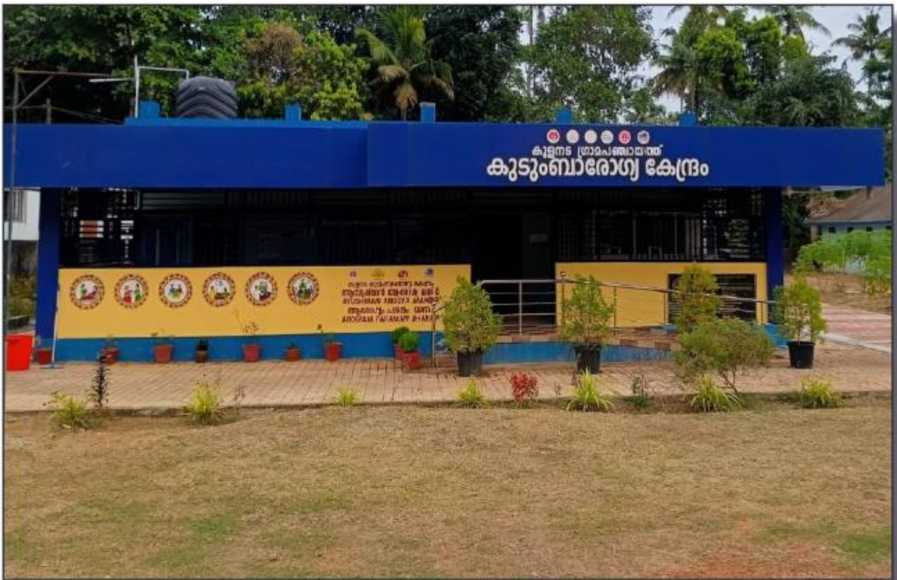
കുളന്തട പ്രാഥമികാരോഗ്യകേന്ദ്രം കൂടുംബാരോഗ്യകേന്ദ്രമായി ഉയർത്തി