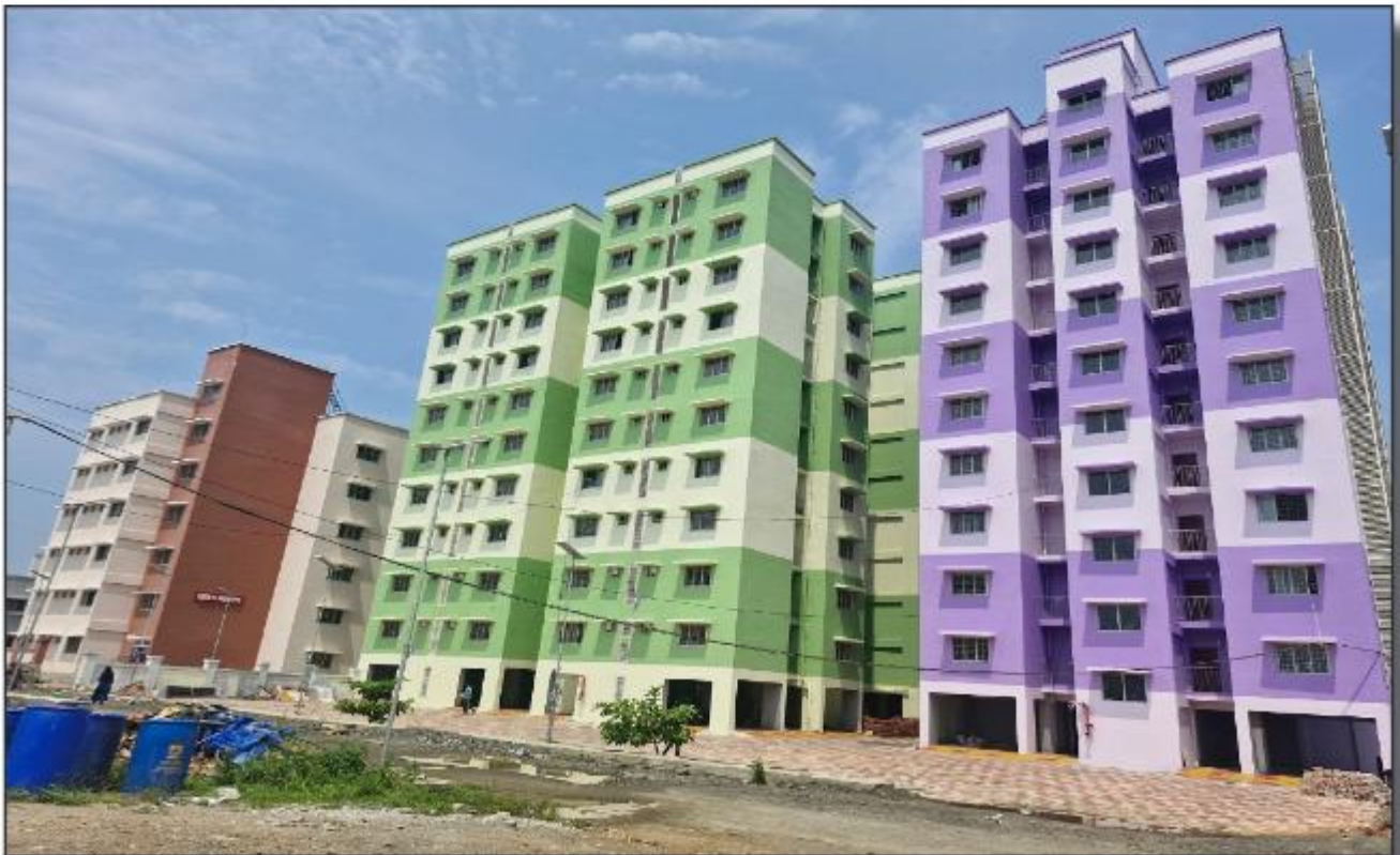
കോന്നി ഡെവലപ്മെന്റ് കോളേജ് വിവിധ നീർമ്മിതികൾ