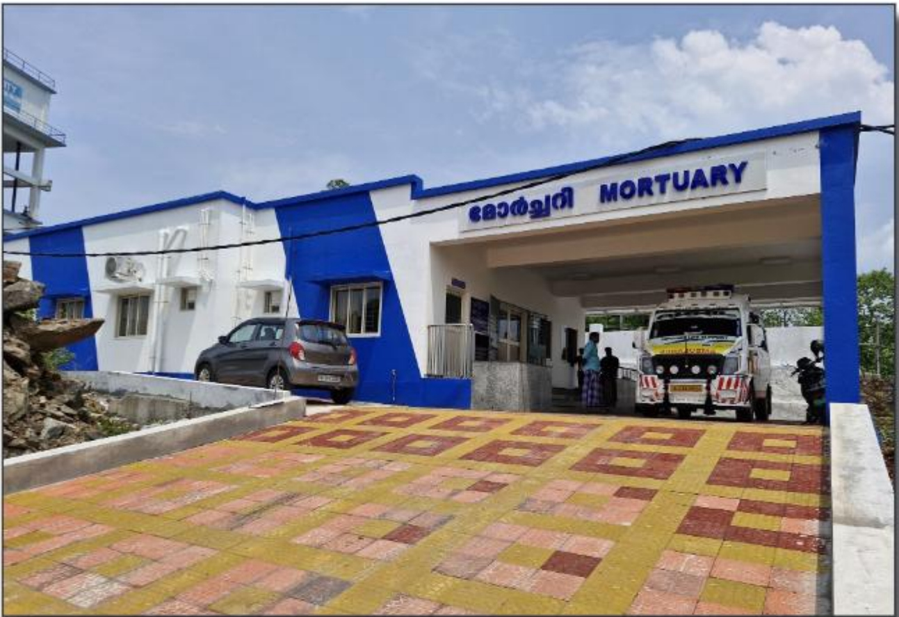
കോന്നി ഡെഡിക്കൽ കോളേജ് - ഓർച്ചരി