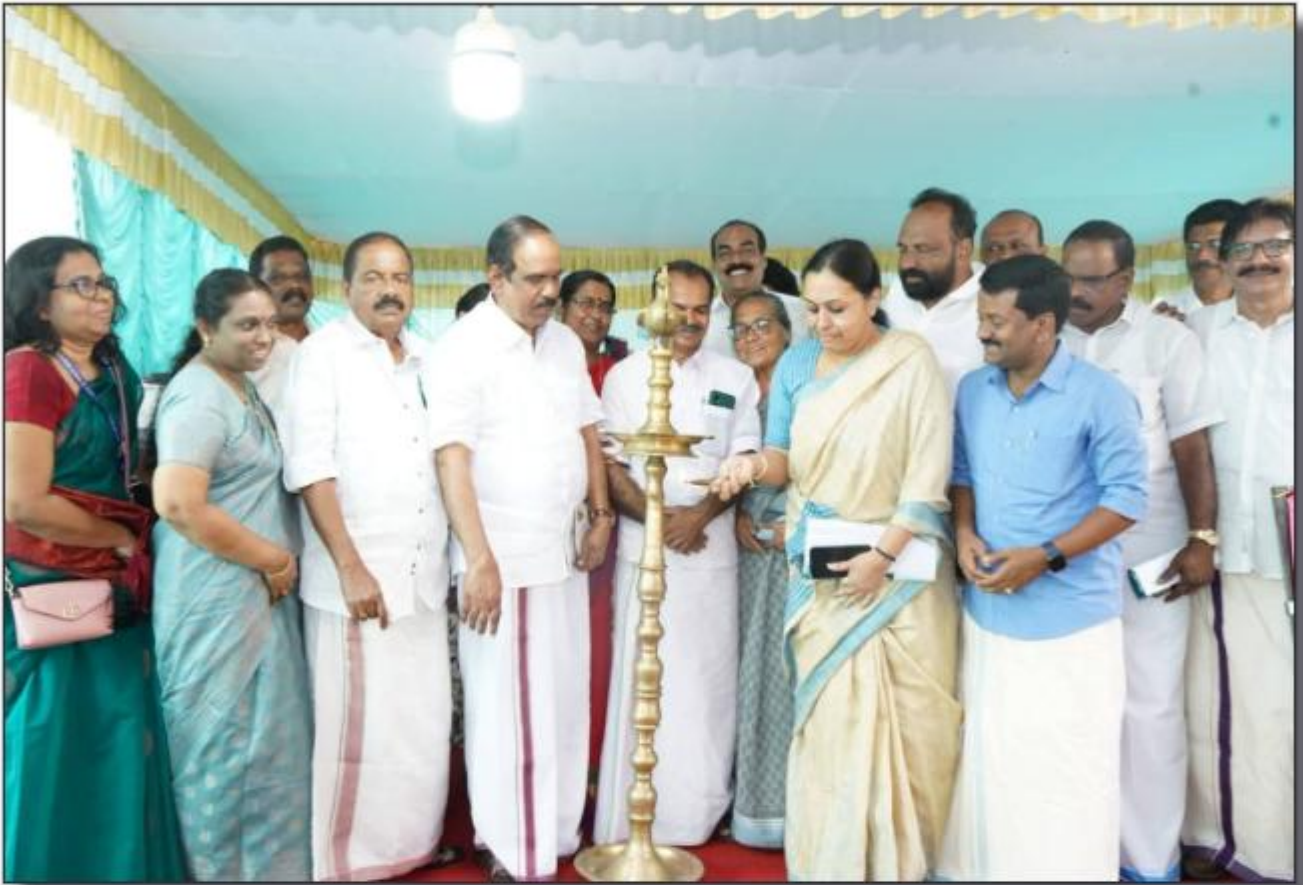
വെള്ളച്ചിറ കുടുംബാരോഗ്യ കേന്ദ്രം പുതിയ കെട്ടിടം തിർമ്മാണ ഉദ്ഘാടനം