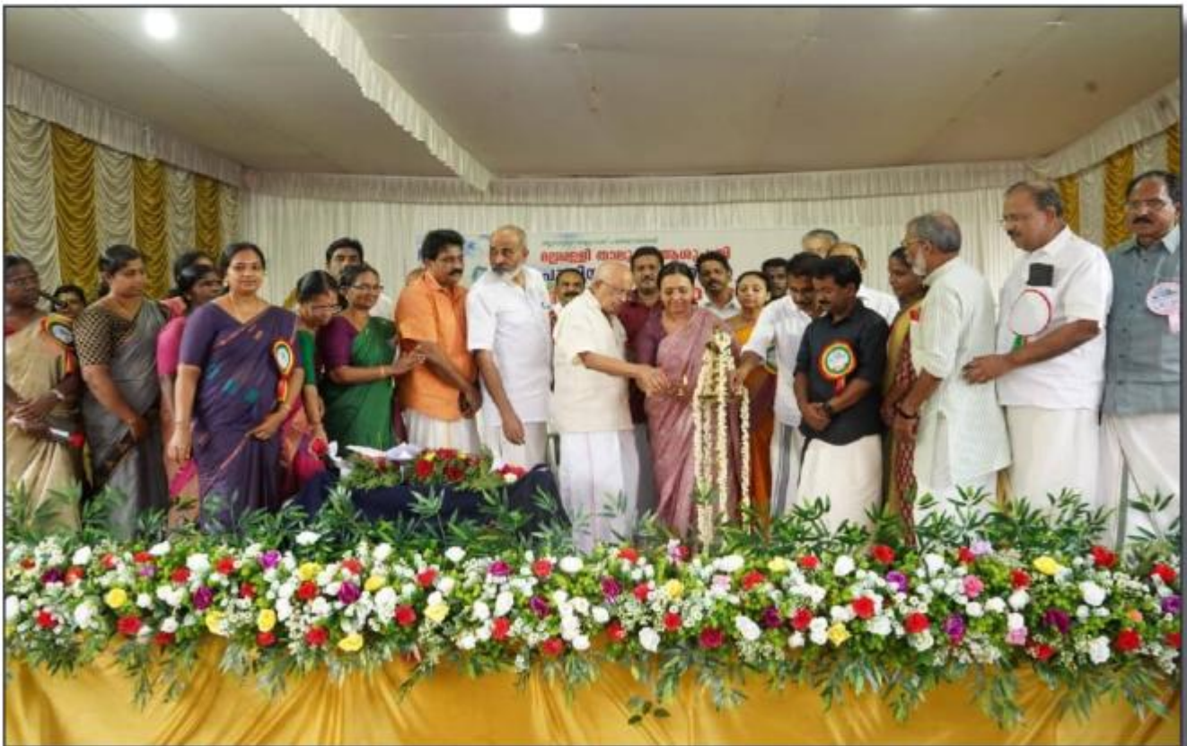
ബുദ്ധജി താലൂക്ക് ആശുപത്രി പുതിയ കെട്ടിടത്തിന്റെ നിർമ്മാണ ഉദ്ഘാടനം