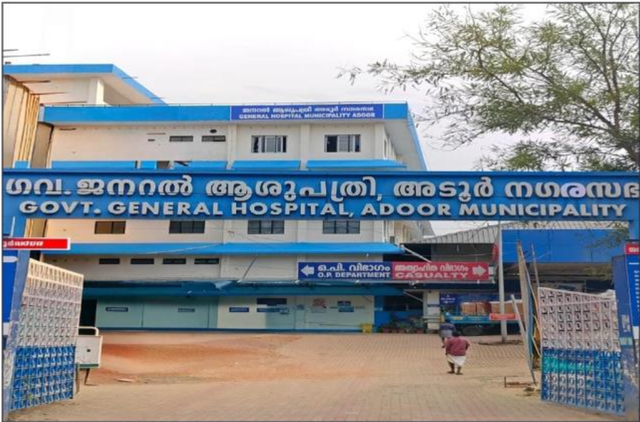
സംസ്ഥാനതലത്തിൽ ആദ്യമായി 3 ദേശീയ അംഗീകാരങ്ങൾ ഒരുമിച്ച് നേടിയ സ്ഥാപനം - ഗവ.ജനറൽ ആശുപത്രി,അടൂർ