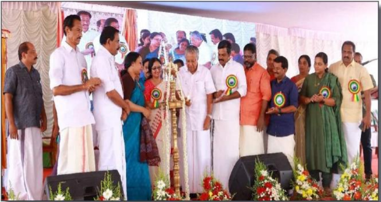
കോന്നി ഡെവലപ്മെന്റ് കോളേജ് അക്കാദമിക് ബ്ലോക്ക് ജവഹരതി ശ്രീപിണറായി വിജയൻ നാടിന് സമർപ്പിക്കുന്നു.