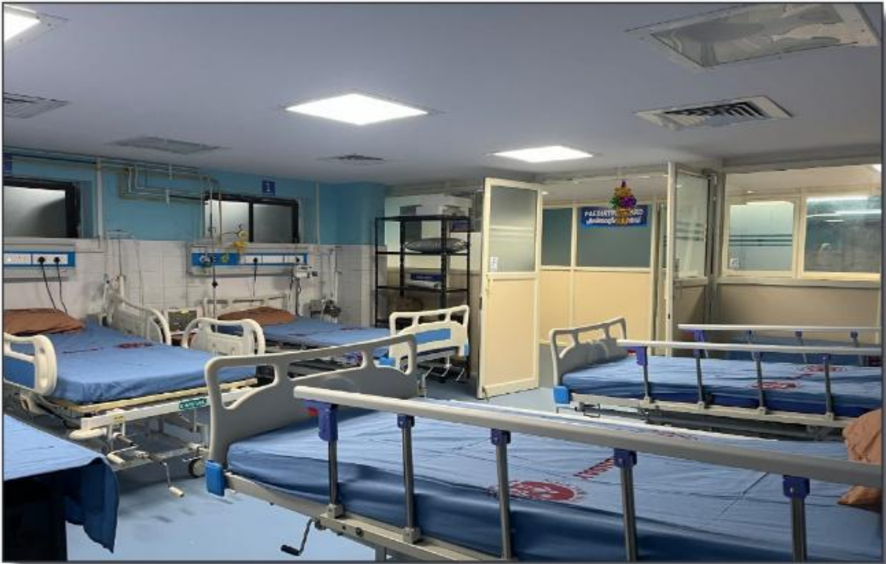
പിഡിയാട്രിക് ഐ.സി.യു ജനറൽ ആശുപത്രി പത്തനംതിട്ട