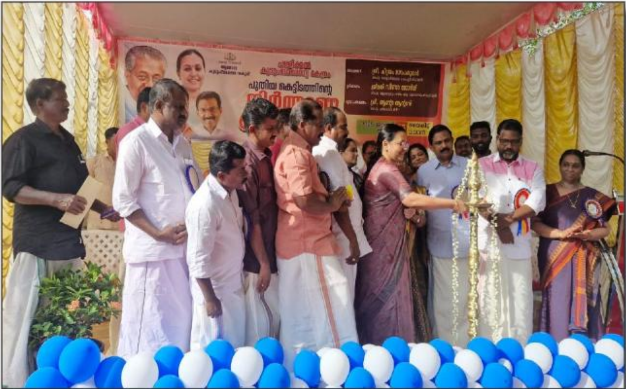
പള്ളിക്കൽ കുടുംബാരോഗ്യകേന്ദ്രം - പുതിയ കെട്ടിടത്തിന്റെ തിർക്കാണോട്ഘാടനം