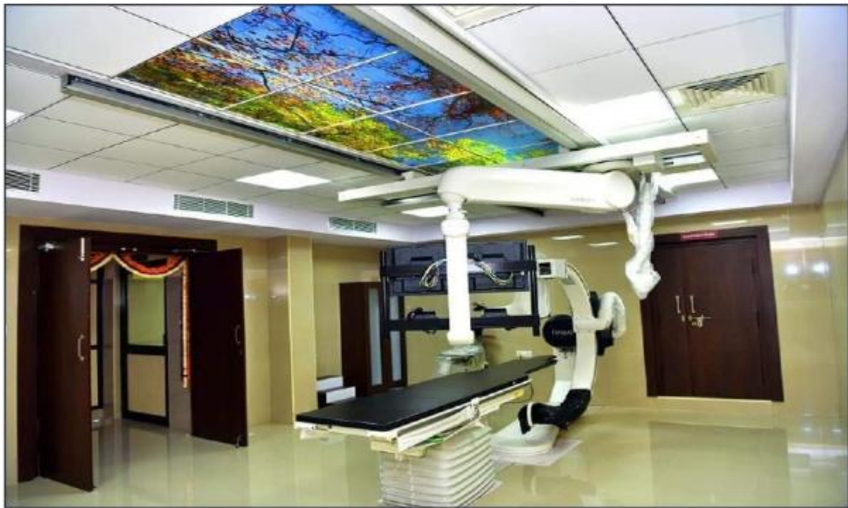
ജനറൽ ആശുപത്രി പത്തനംതിട്ട കാത്ത് ലാബ് ശാക്തീകരണത്തിനായി 2 കോടി രൂപ