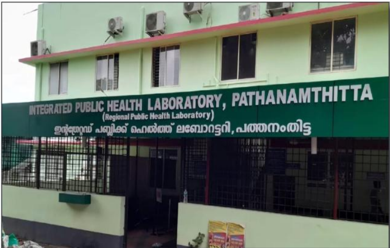
ഇന്റഗ്രേറ്റഡ് പബ്ലിക് ഹെൽത്ത് ലബോറട്ടറി കോഴഞ്ചേരി