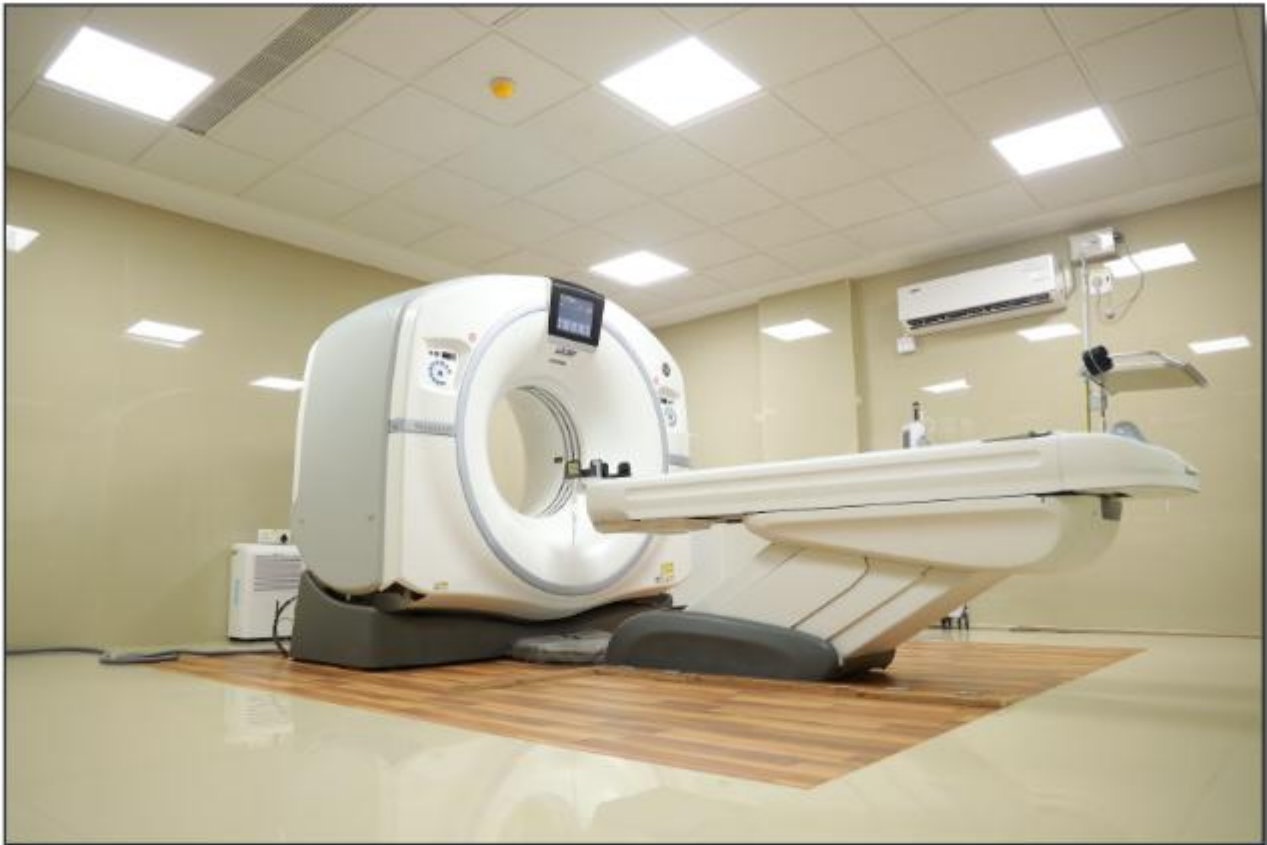
5 കോടി രൂപ മുതൽ മുടക്കിയിട്ടുള്ള 128 സ്ലൈസ് സിടി സ്കാൻ മെഷീൻ