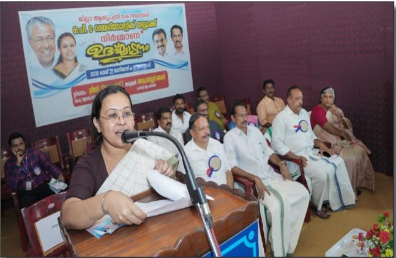
കോഴഞ്ചേരി ജില്ലാ ആശുപത്രി - ഐ & ഡയഗ്നോസ്റ്റിക് ബ്ലോക്കിന്റെ തിർമ്മണോദ്ഘാടനം - കിഫ്ബി പ്രോജക്ട്