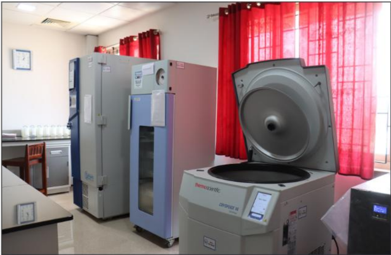
ബ്ലഡ് സ്റ്റോറേജ് യൂണിറ്റ് - കോന്നി മെഡിക്കൽ കോളേജ്