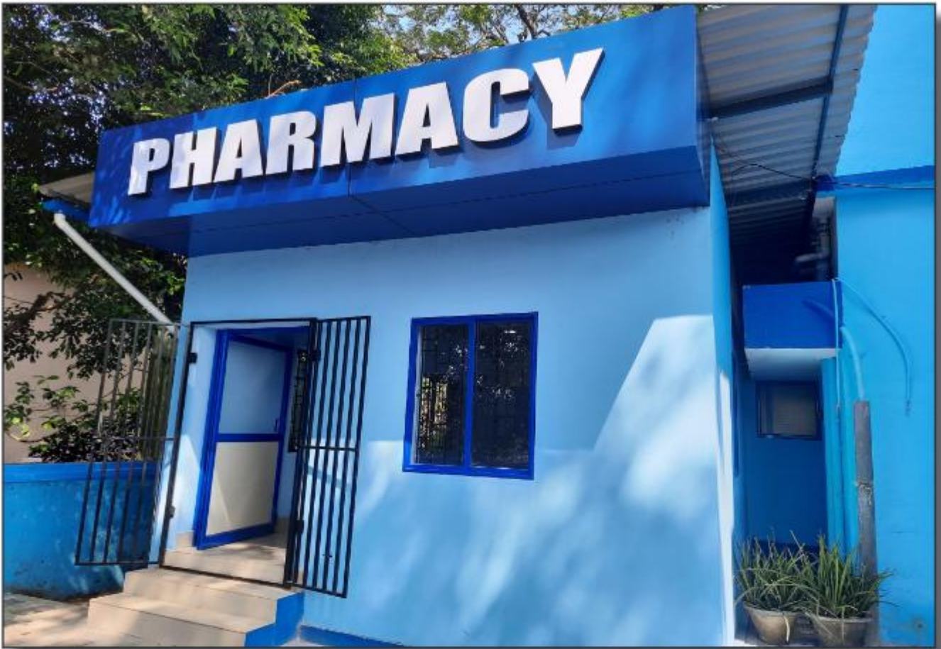
തവീകരിച്ച ഫാർമസി - നാന്നി താലൂക്കാസ്ഥാന ആശുപത്രി