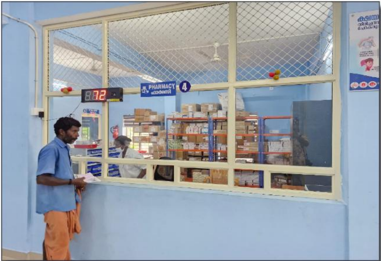
വള്ളിക്കോട് കുടുംബാരോഗ്യകേന്ദ്രം - ഫാർമസി