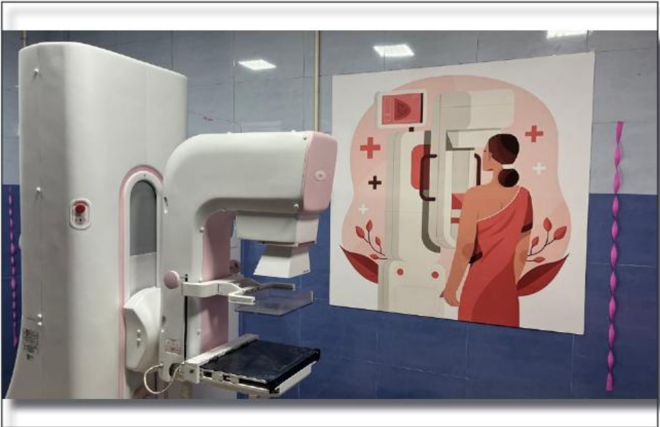
ഓരോഗ്യം ക്ഷേമം ജനറൽ ആശുപത്രി പത്തനംതിട്ട