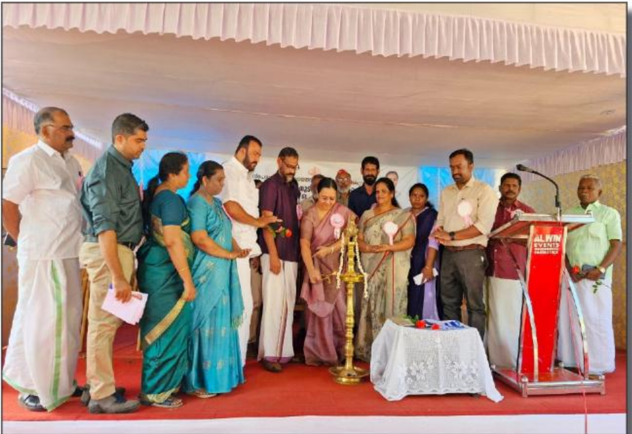
ഓതറ കൂടുംബാഹോഗ്യകേന്ദ്രം - പുതിയ കെട്ടിടത്തിന്റെ തീർക്കാണോദ്ഘാടനം