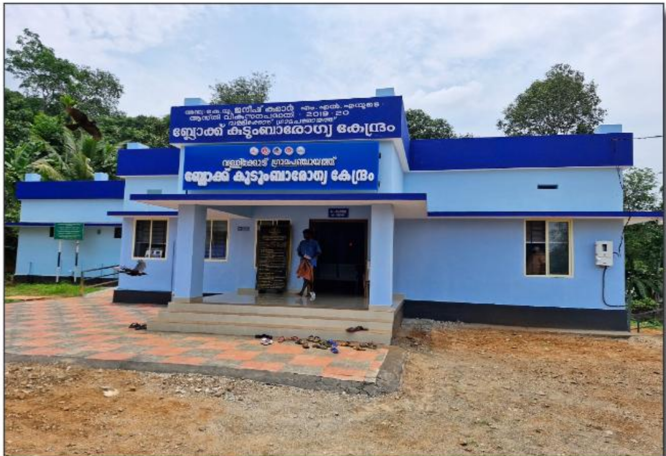
വള്ളിക്കോട് ബോധി ക്വട്ടുംബാരോഗ്യകേന്ദ്രം - 1 കോടി 8 ലക്ഷം രൂപ മുതൽ മുടക്കിൽ പുതുതായി നിർമിച്ച കെട്ടിടം