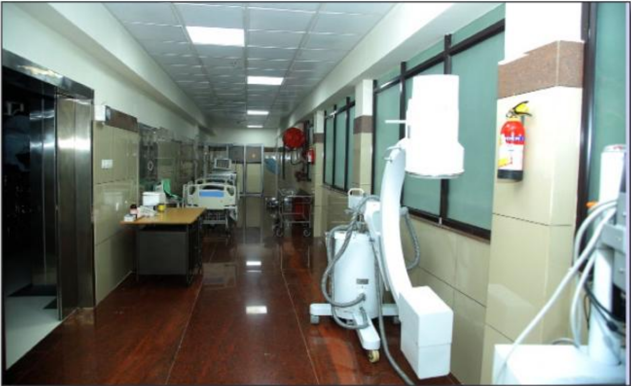
നവീകരിച്ച ഓപ്പറേഷൻ തിയേറ്റർ - തിരുവല്ല താലൂക്കാസ്ഥാന ആശുപത്രി