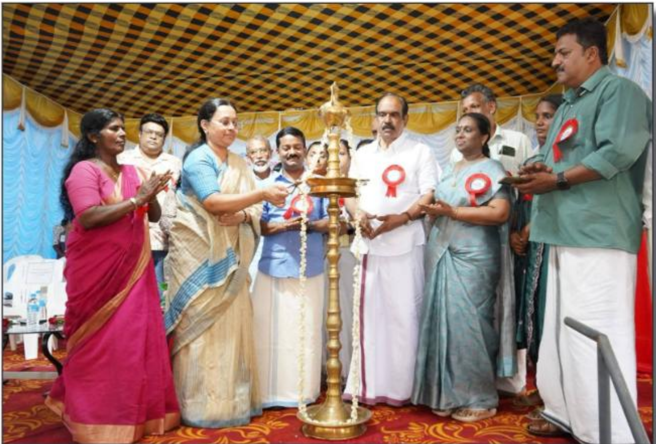
കൊറ്റനാട് പ്രാഥമിക ആരോഗ്യ കേന്ദ്രം പുതിയ കെട്ടിടം തിർമ്മാണ ഉദ്ഘാടനം