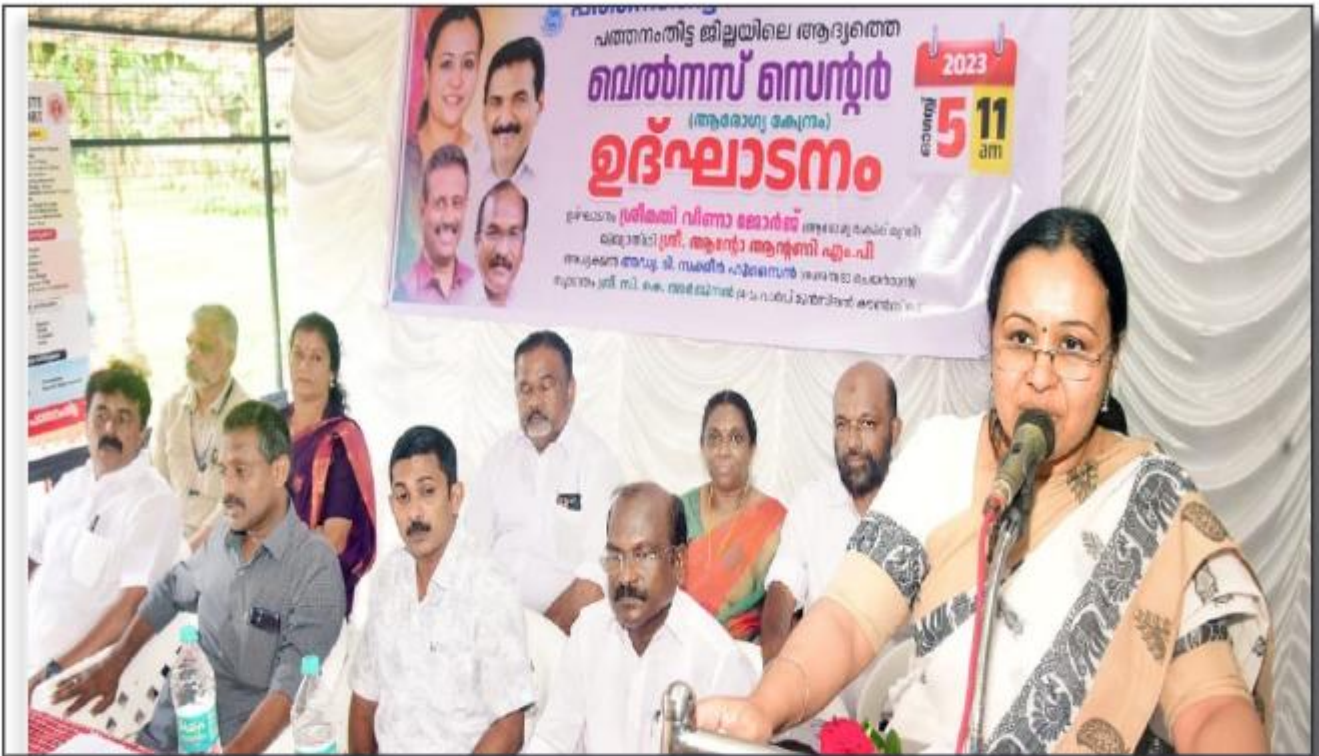
പത്തനംതിട്ട ജില്ലയിലെ ആദ്യ നഗര ജനകീയാരോഗ്യകേന്ദ്രം ബഹു.ആരോഗ്യവകുപ്പു മുന്തി ശ്രീമതി.വിനോ ജോർജ്ജ് ഉദ്ഘാടനം ചെയ്യുന്നു