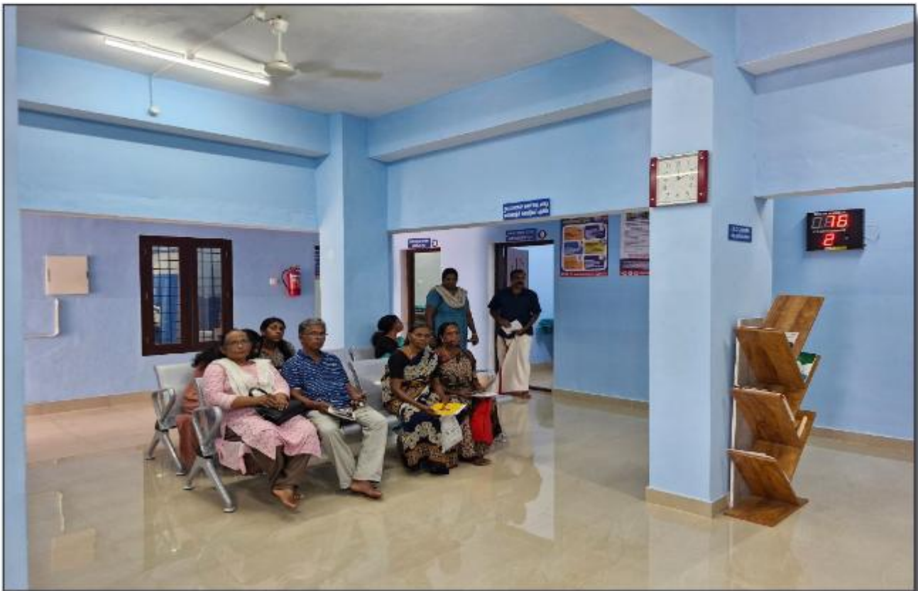
വള്ളിക്കോട് കുടുംബാരോഗ്യകേന്ദ്രം - സൗകണ്ഡ് വെയിറ്റിംഗ് ഏരിയ