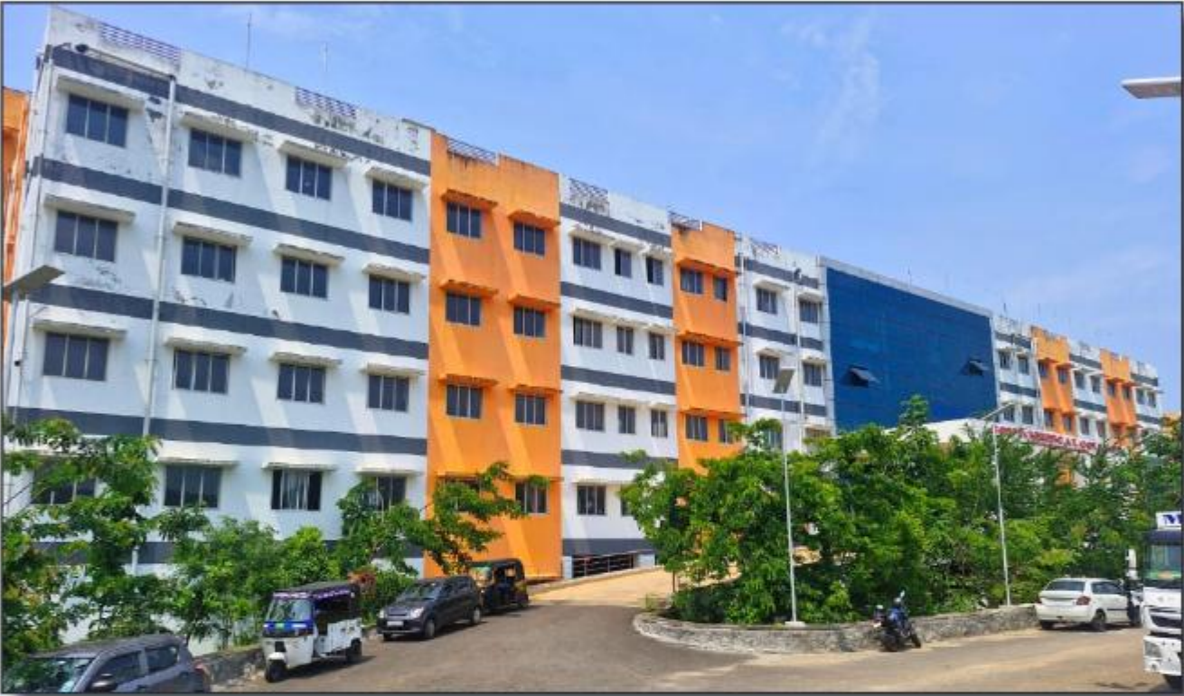
കോന്നി മെഡിക്കൽ കോളേജ് ആശുപത്രി, പ്രധാന കെട്ടിടം