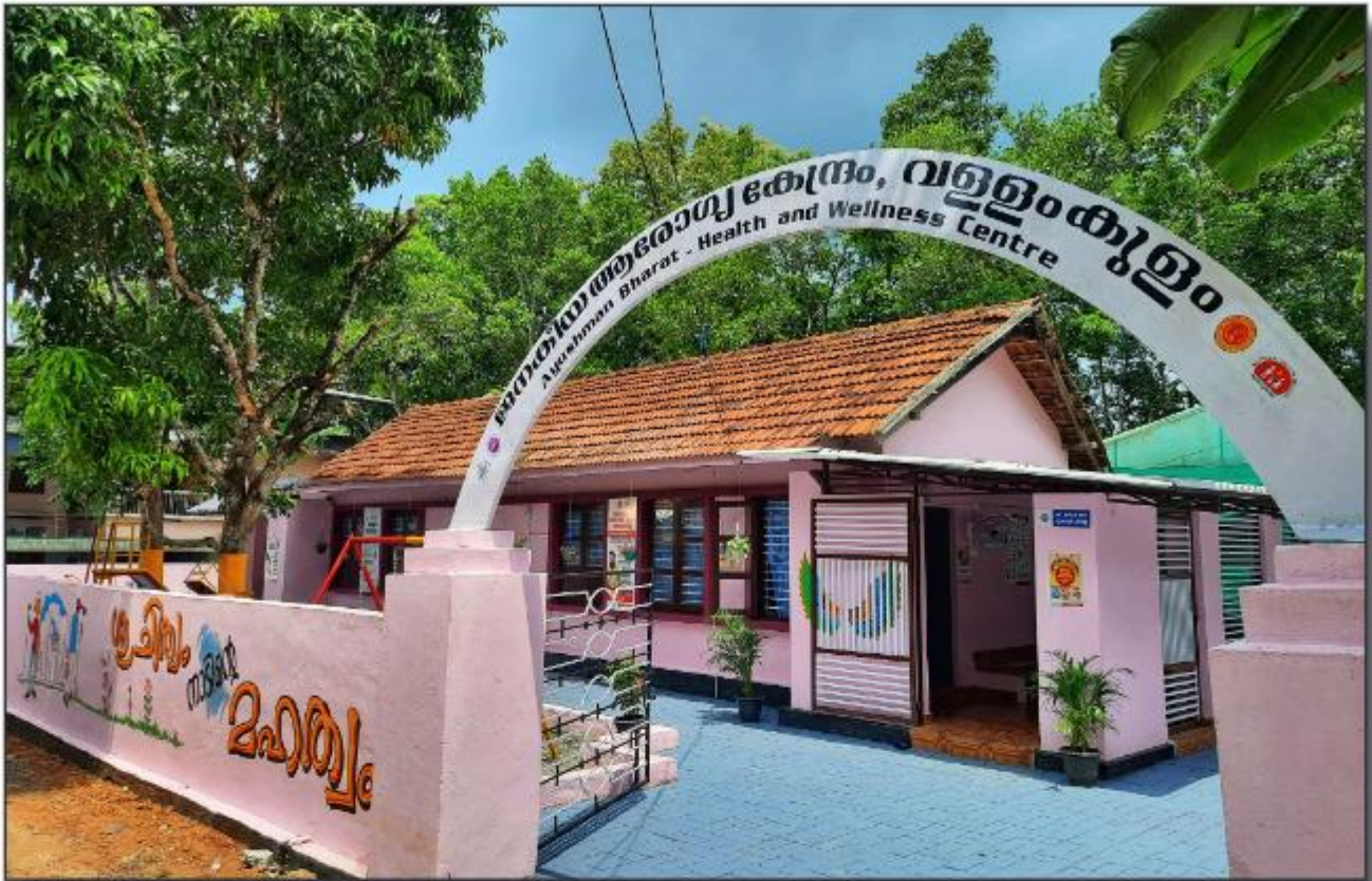
ഇനക്കിയ ആരോഗ്യകേന്ദ്രം വള്ളംകുളം