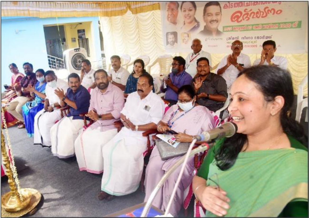
റാന്നി - പെരുന്താട് സാമൂഹ്യാരോഗ്യ കേന്ദ്രം - കിടത്തി ചികിത്സാ സൗകര്യം ആരംഭിച്ചു.