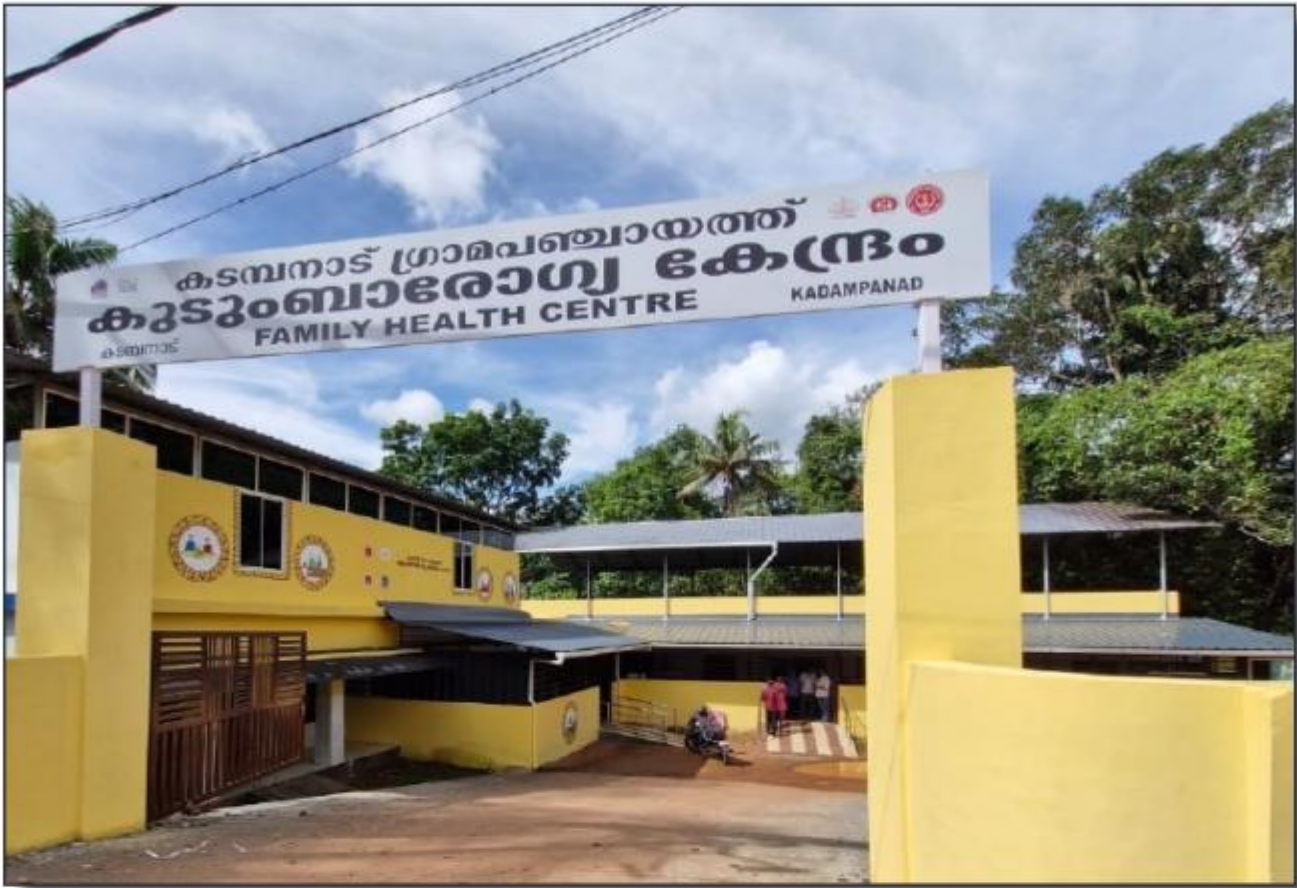
നവീകരണം പൂർത്തിയാക്കിയ കടമ്പനാട് കുടുംബാരോഗ്യകേന്ദ്രം