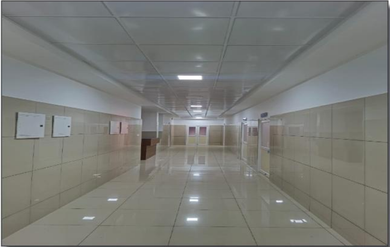
ലക്ഷ്യ ലേബർ റൂം & വാർഡ് ജില്ലാ ആശുപത്രി കോഴഞ്ചേരി