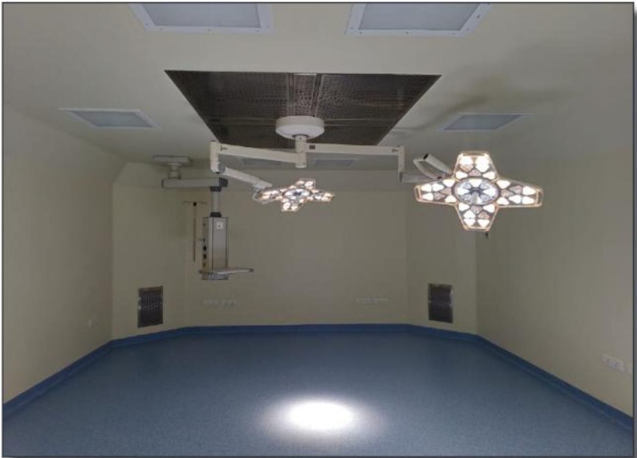
ലക്ഷ്യനിലവാരത്തിൽ നിർമ്മാണം പൂർത്തിയായ ഹൈനക് ഓപ്പറേഷൻ തിയേറ്റർ